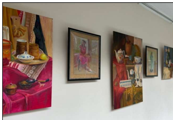
Рис. 2. Выставка лучших учебных работ «По итогам летней сессии 2023-2024»