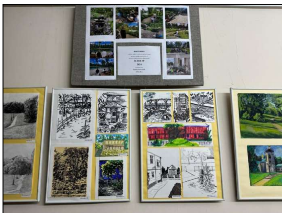
Рис. 1. Выставка учебных работ студентов «Пленэр 2024»

Проводятся выставки лучших учебных работ по итогам экзаменационных сессий, участниками которых могут стать студенты всех курсов и профилей (рис. 2). При формировании экспозиции кураторы выставки проводят еще один отбор, что обусловлено требованием избегать повторения одинаковых постановок и ракурсов в изображениях, а также необходимостью колористического разнообразия. Выбор работ может определяться форматом или техникой исполнения заданий. Например, если в выставку запланировано включить только крупноформатные работы, исполненные в технике масляной живописи, то работы, выполненные акварелью, войдут в другую экспозицию.