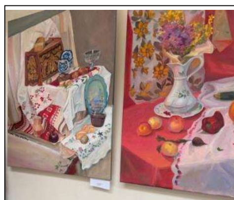
Рис. 4. Выставка лучших учебных работ по итогам зимней сессии 2024–2025 уч. г. «Наши свершения»

Не менее интересно прошла выставка, посвященная конкурсу плакатов к 80-летию Великой Победы. В конкурсе приняло участие 16 студентов высшего образования различных профилей. Студенты работали в команде: выполнение плакатов осуществлялось поэтапно. Некоторые студенты приняли участие в разработке эскизов, некоторые отрисовывали изображение, кто-то отвечал за исполнение деталей. Коллективная работа над плакатами вдохновила студентов, они решили не ограничиваться простой развеской. По инициативе студентов экспозиция была дополнена букетами из гвоздик из цветной бумаги. В итоге простое экспозиционное решение мотивировало студентов к совместной работе, а обычная выставка трансформировалась в тематическую инсталляцию. Так студенты впервые попробовали себя в организации выставочного пространства.