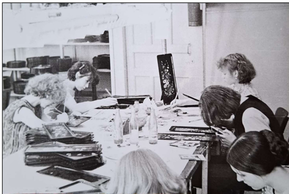
Рис. 1. Учащиеся Московской школы художественных ремёсел на практике в мастерской декоративной росписи производственного объединения «Художественная гравюра»

В 1977 г. Московская школа художественных ремёсел являлась профессионально-техническим учебным заведением и осуществляла начальную профессиональную подготовку учащихся отделения «Роспись по металлу» для работы на производственном объединении «Художественная гравюра» (рис. 1 33 ). Исходя из цели подготовки художника росписи по металлу было сформировано содержание обучения мастерству и определена специфика учебных заданий.