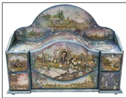
Рис. 6. В. Юркова. Выпускная квалификационная работа на тему: «Оформление предметов мебели декоративной росписью “Прогулки с А.П. Чеховым”» (настольное бюро)