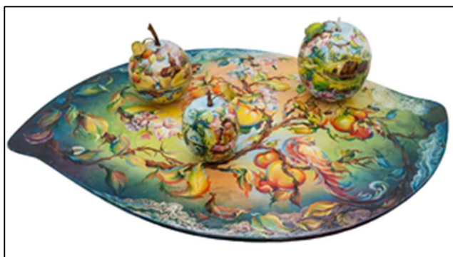
Рис. 5. Е. Емельянова. Выпускная квалификационная работа на тему: «Применение смешанной техники в изображении пейзажных и цветочных мотивов на лаковых изделиях “Яблочный спас”» (поднос и три шкатулки)

Выпускные квалификационные работы обучающихся по этой программе были представлены широким разнообразием форм-основ в виде небольших объёмных изделий: ларцов, шкатулок и комплектов настольных предметов. Доминирующее место в росписи большинства изделий занимали приёмы исполнения миниатюрного изображения. Например, композиция ларца, выполненного А. Авраменко, включает изображения человека, птицы, пейзажа и групп цветов; выпускная работа Е. Емельяновой представлена на подносе в форме листа и трёх шкатулок в виде яблок, роспись содержит изображения ветки яблок с листьями и цветами, насекомых, птицы, пейзажей и натюрмортов (рис. 5); в центре работы Н. Петянкиной расположена многофигурная композиция, окружённая цветами лилии и орнаментом, вдохновлённым традиционными резными наличниками; настольное бюро В. Юрковой украшено пейзажами, изображающими чеховские места, акцент сделан на предметы и цветы на рабочем столе, а также портрет писателя (рис. 6); в шкатулке-ларце «Бородино» А. Сафонова гармонично сочетаются натюрморты и пейзажи.