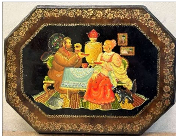
Рис. 2. Поднос «Чаепитие» в технике маховой двухцветной нижнетагильской декоративной росписи

Техника многослойной живописи близка к станковой живописи масляными красками, в композициях которой особое значение имеет тональное решение (рис. 3). Тон используется для создания эффекта глубины пространства.