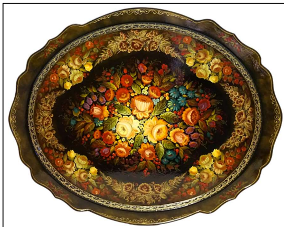
Рис. 1. Поднос в технике маховой двухцветной нижнетагильской декоративной росписи

В маховой технике исполняются сюжетные композиции с фигурами людей: бытовые сцены, праздники, народные гуляния, чаепития и т.д. (рис. 2). Сюжетные композиции основаны на выразительном силуэте изображаемых фигур людей и предметов быта. Грамотно найденный силуэт помогает создать художественный образ в произведении.