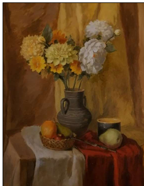
Рис. 5. Учебное задание по живописи «Живописный этюд натюрморт с включением букета цветов»