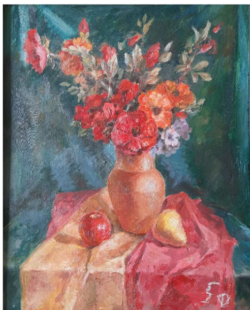
Рис. 6. Учебное задание по живописи «Живописный этюд натюрморт с включением букета цветов» Симметричное расположение композиции