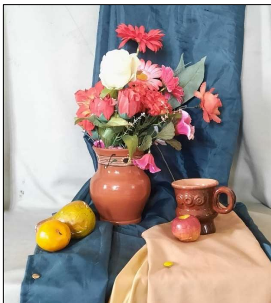
Рис. 8. Фотография постановки натюрморта с букетом цветов. Композиция постановки вписана в геометрический треугольник

Во многих видах искусства ритм играет важную и разнообразную роль. Само слово ритм происходит от греческого слова «rhythmos» – движение, такт. Ритм помогает выявить суть произведения, создать целостное и образное произведение. В нижнетагильской декоративной росписи ритм создает упорядоченность и чередование элементов живописного изображения. Зритель, воспринимая изображение, стремится упорядочить и обобщить видимые формы, свести их к простым геометрическим: кругу, квадрату, треугольнику. Использование геометрических фигур должно закладываться в схему организации живописной и графической постановки натюрморта (рис. 8, 9). Использование геометрических фигур в выстраивании ритма помогает выделить главное в композиции произведения и объединить элементы живописного изображения.