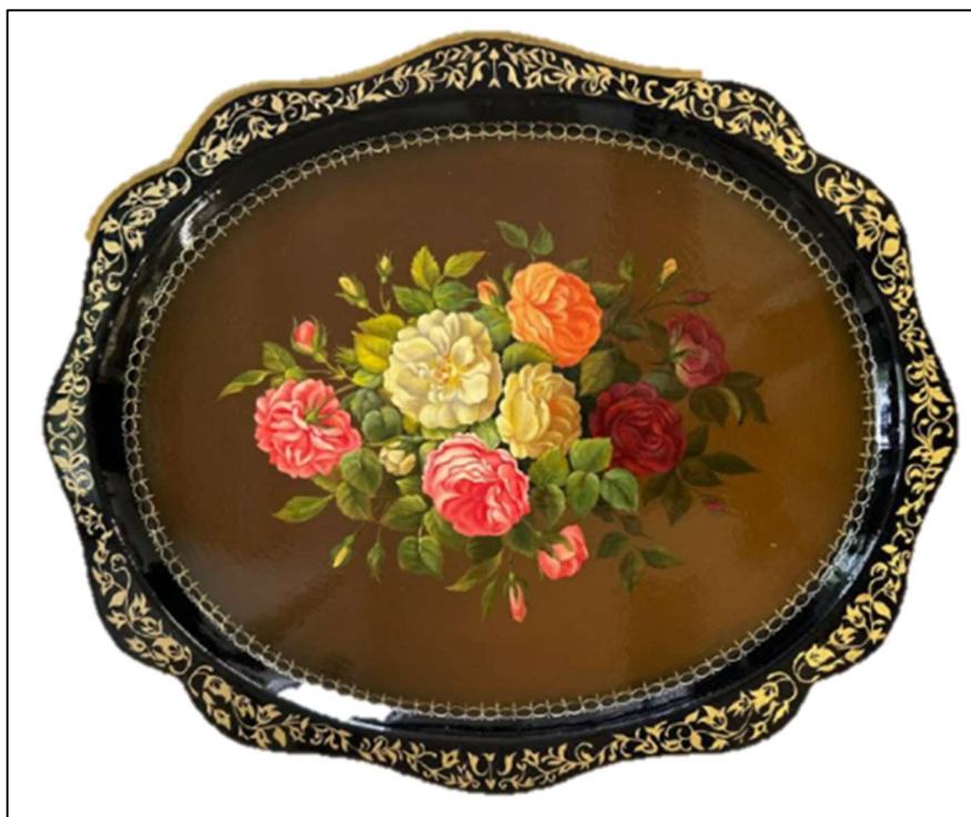
Рис. 3. Поднос в технике многослойной нижнетагильской декоративной росписи

Иначе строится композиция и колорит в нижнетагильской декоративной росписи, выполненной в технике многослойной масляной живописи. На рисунке 3 показан поднос, выполненный в технике многослойной масляной живописи, в котором колорит строится на сближенных тональных отношениях, в такой живописи важна «погруженность» изображаемого букета в пространство фона. Освещенность передается путем использования мягких касаний, когда края бутонов цветка мягко растворяются в фоне. Подобный эффект можно получить, используя прозрачные, тонкие слои краски – лессировки.