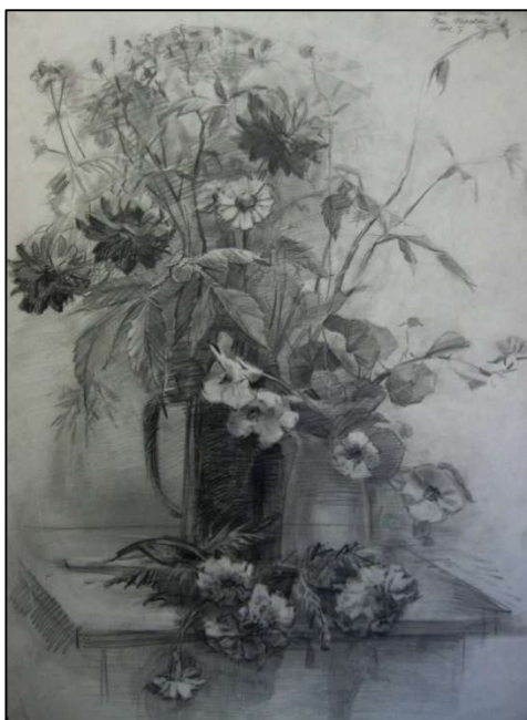
Рис. 4. Учебное задание по рисунку «Рисунок натюрморта с включением букета цветов»