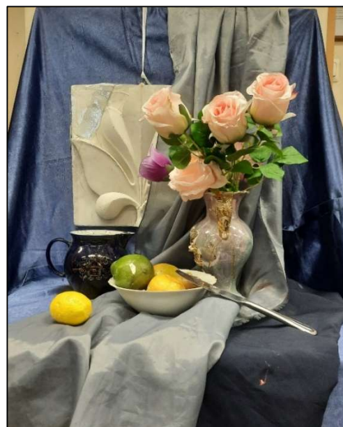
Рис. 9. Фотография постановки натюрморта с букетом цветов. Композиция постановки вписана в геометрический квадрат

Еще одним важным элементом композиции является контраст, который основывается на противопоставлении масштаба (размера), тона, цвета, движения, фактуры, силуэта изображаемых предметов или частей в художественном произведении для усиления образного звучания работы.