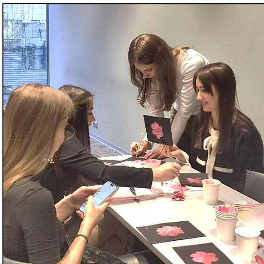
Рис. 14. Мастер-класс по декоративной росписи «московское письмо»