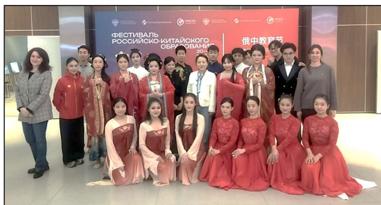
Рис. 13. Участники Фестиваля Российско-Китайского образования

Программа фестиваля была чрезвычайно насыщенной: помимо упомянутых мероприятий состоялись мастер-классы по чайной церемонии, каллиграфии, игре в маджонг, китайскому разговорному языку, демонстрация элементов ушу, презентации книг и многое другое (рис. 13-15).