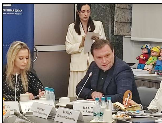
Рис. 4. Круглый стол «Безопасное детство: традиционная игрушка как основа гармоничного развития личности»