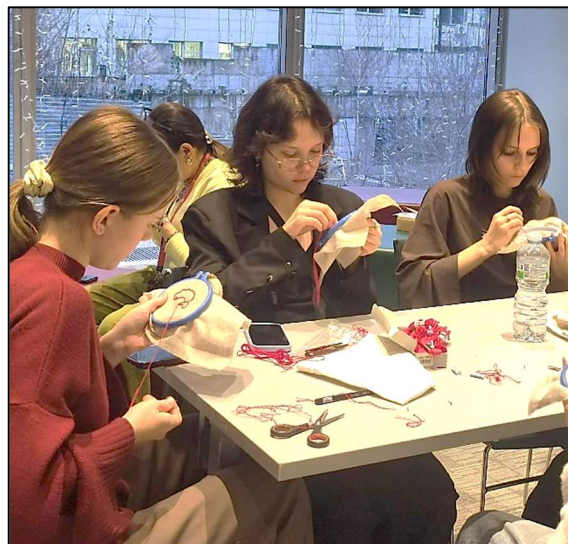
Рис. 15. Мастер-класс по художественной вышивке

В целом, участие Российского университета традиционных художественных промыслов в столь масштабных мероприятиях демонстрирует устойчивый интерес к результатам научно-исследовательской и художественно-творческой деятельности университета не только в российском, но и международном сообществе.