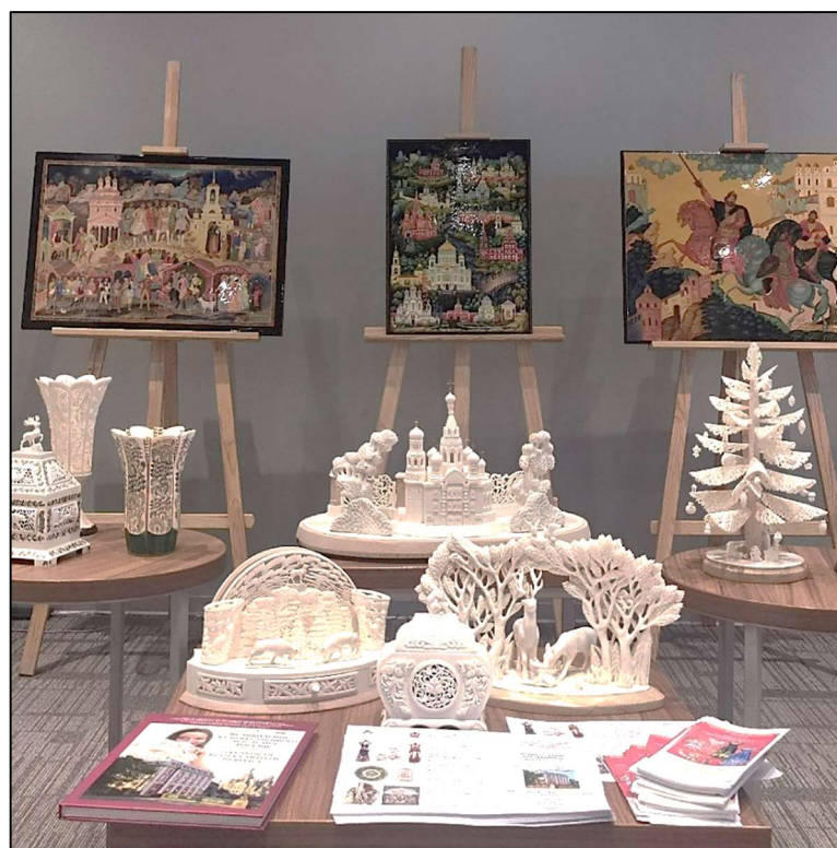
Рис. 11. Выставка выпускных квалификационных работ обучающихся Российского университета традиционных художественных промыслов «Великолепие художественного наследия России»