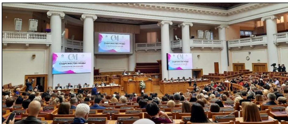
Рис. 6. Пленарное заседание IV Культурно-экономического форума «Содружество моды» прошел в Таврическом дворце (г. Санкт-Петербург)