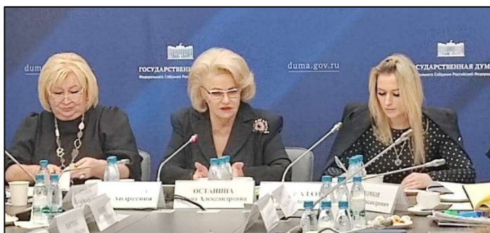
Рис. 2, 3. Круглый стол «Безопасное детство: традиционная игрушка как основа гармоничного развития личности»