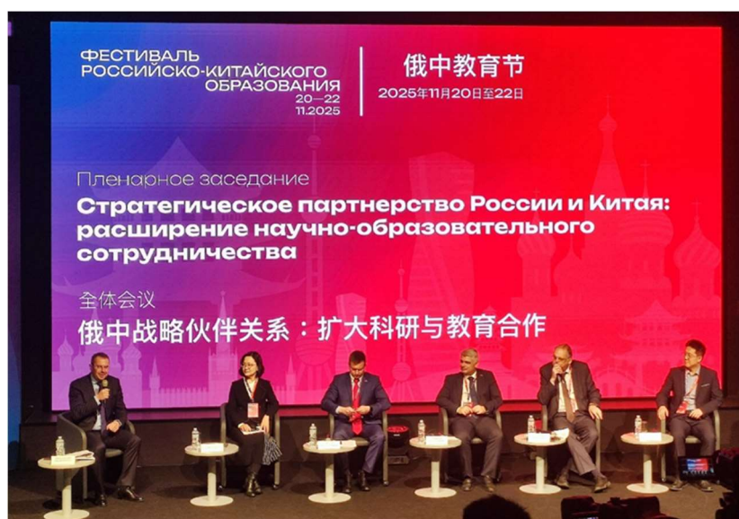
Рис. 10. Открытие Фестиваля Российско-Китайского образования

Далее центр научной активности вуза вновь переместился в Москву, где Российский университет традиционных художественных промыслов принял участие в Фестивале Российско-Китайского образования, который состоялся 20–22 ноября 2025 г. по инициативе Министерства науки и высшего образования в Университете науки и технологий МИСИС (рис. 10).