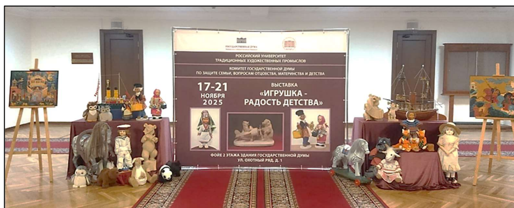
Рис. 1. Выставка «Игрушка. Радость детства» в Государственной Думе Федерального Собрания Российской Федерации

С 17 по 21 ноября в Государственной Думе Федерального Собрания Российской Федерации состоялась выставка «Игрушка. Радость детства», инициированная Комитетом Госдумы по защите семьи, вопросам отцовства, материнства и детства и Российским университетом традиционных художественных промыслов. На выставке были представлены игрушки, а также произведения богородской художественной резьбы по дереву, мстёрской и холуйской лаковой миниатюрной живописи, объединенные темой детства (рис. 1 1 ).