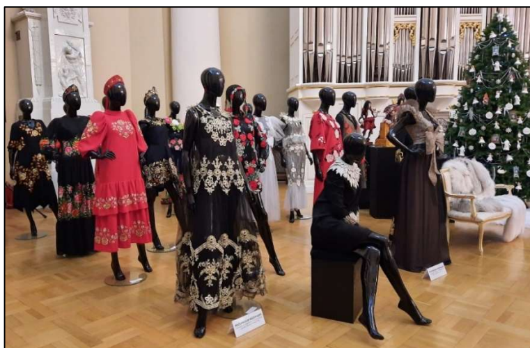
Рис. 7. Произведения художественной вышивки и художественного кружевоплетения