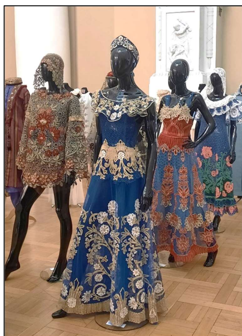
Рис. 8, 9. Произведения художественной вышивки и художественного кружевоплетения