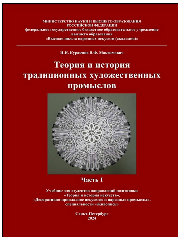
Рис. 1. Обложка книги «Теория и история традиционных художественных промыслов»

материала, ключевых слов, персоналий, вопросов для самопроверки, практических заданий и списка рекомендованной литературы.