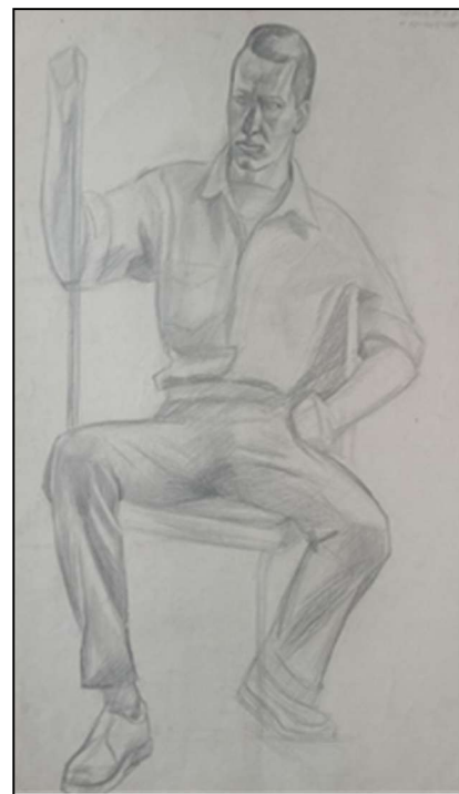
Рис. 6. Чижов К. Рисунок одетой фигуры натурщика. 2 курс, бакалавриат

В данном случае допустимо пренебрежение изображением рефлексов и тонкими тональными переходами ради создания целостной декоративной формы. При проработке деталей складки одежды трактуются как декоративные элементы, характерные для деревянной скульптуры богородской резьбы по дереву. Черты лица (глаза, нос, губы) изображаются схематично и подчиняются общей художественной концепции (рис. 6).