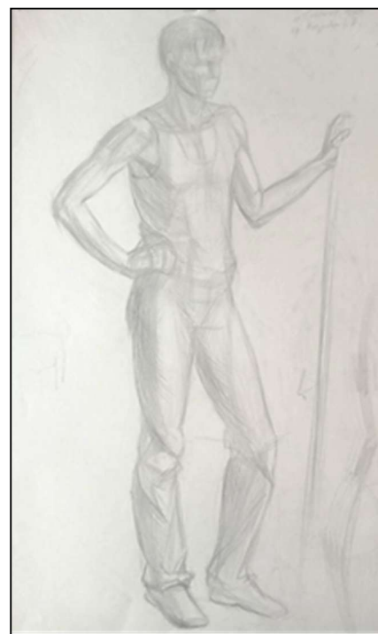
Рис. 2. Баринов А. Зарисовка одетой фигуры натурщика с натуры. 2 курс, бакалавриат

Развивая декоративное художественное видение в процессе переработки академического рисунка, обучающиеся впоследствии применяют его на практике. На рисунке 4 представлено изображение фигуры натурщика, выполненное в технике декоративного рисунка, с характерным обобщением деталей, благодаря этому она выглядит монолитной, более статичной, чем есть на самом деле. Стоит отметить, что при выполнении данного задания делается акцент на то, что некоторые формы, изображаемые в академическом рисунке, могут быть несколько видоизменены, упрощены или могут не изображаться (рис. 3). Таким образом, подобная декоративная переработка обобщает академическую форму рисунка, делает её монументальной и менее детализированной. В то время, как стандартные приемы создания декоративности чаще всего подразумевают под собой дробление формы.