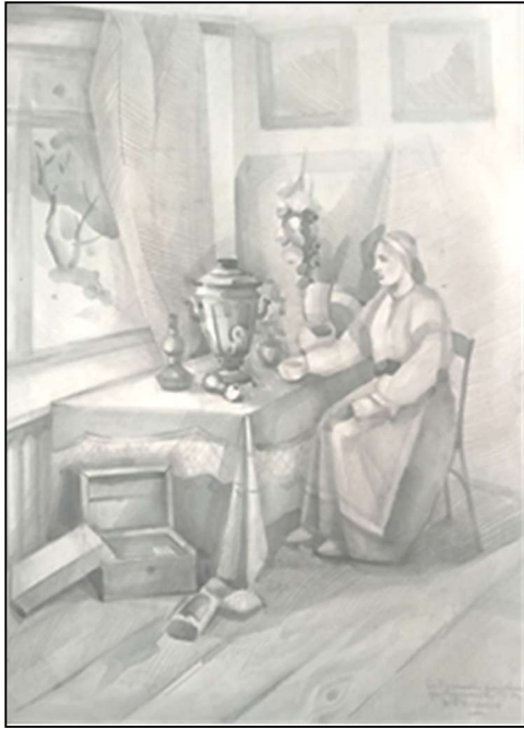
Рис. 3. Евдокимова Е. Рисунок одетой фигуры натурщицы в интерьере. Декоративная переработка. 3 курс, бакалавриат