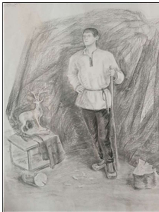
Рис. 5. Чижов К. Рисунок одетой фигуры натурщика в интерьере. 3 курс, бакалавриат

При изучении декоративного рисунка студенты осваивают основы анатомии, при этом, декоративный рисунок не искажает форму мускулатуры и не нарушает пропорции фигуры. В отличие от академического рисунка, декоративная трансформация предполагает структурирование форм с акцентом на ритмичность. Именно в этом заключается одно из ключевых