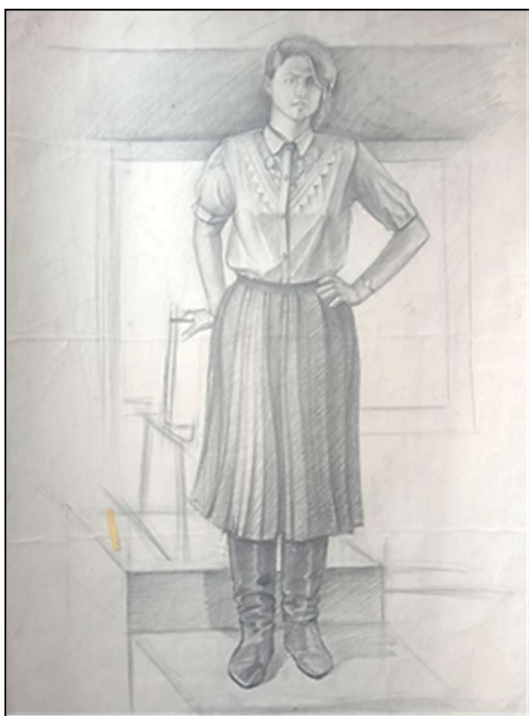
Рис. 1. Симора И. Одетая фигура человека в интерьере. Декоративная переработка, рисунок с натуры. 2 курс, бакалавриат

составляющей и распределению основных масс, формирующих структуру изображаемого объекта. Например, в академическом рисунке мускулатура человеческого тела передается мягкими, округлыми линиями, в то время как при декоративной трансформации изображение подвергается упрощению, общая форма сохраняется, а в рисунке прослеживаются элементы простых геометрических фигур. Выполняя подобные упражнения, студент приобретает способность различать реалистичное изображение конкретного движения и его более утрированную интерпретацию в декоративной композиции.