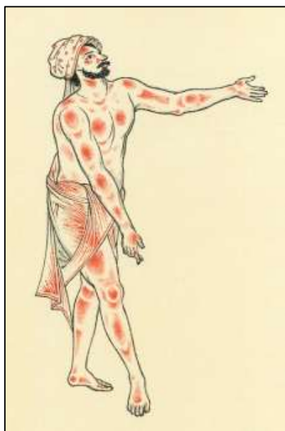
Рис. 6. Фрагмент рисунка из альбома Н.М. Зиновьева «Стилистические традиции искусства Палеха»

Как правило, в лаковой миниатюре фигуры изображаются в одежде, остаются открытыми только лица, кисти, иногда стопы. Общая пластика передается через складки одежды, которые также следуют анатомической конструкции тела и законам его движения. Складки напряжены на выступающих частях тела и спадают свободными волнами, подчеркивают движения фигуры и ее конечностей, обозначают сгибы суставов (рис. 7).