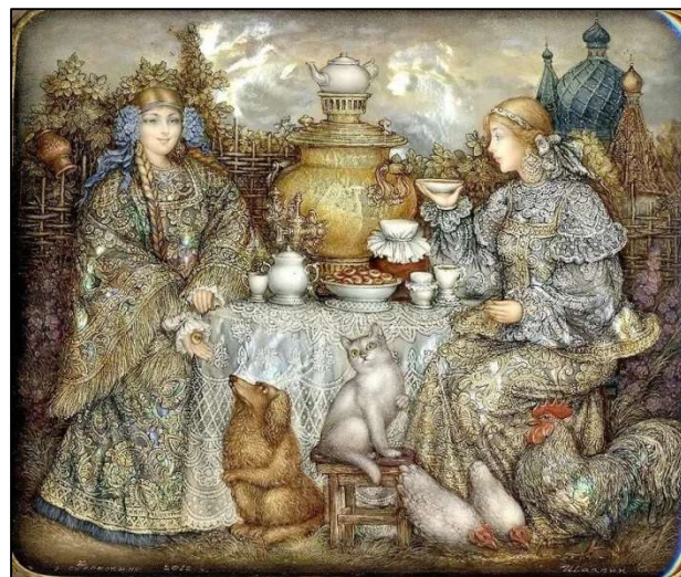
Рис. 2. О.И. Шапкин. Шкатулка «Чаяпитие». Федоскинская лаковая миниатюрная живопись. 2012 г. Коллекция Ю. Славски (Великобритания)

Музей декоративно-прикладного искусства (г. Москва)