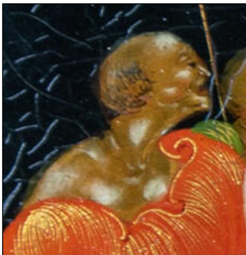
Рис. 9. И.И. Голиков. Панно «Речь Стеньки Разина к голытьбе», фрагмент. Палехская лаковая миниатюра. 1924 г. Государственный музей палехского искусства