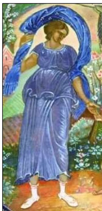
Рис. 4. В.Ф. Некосов. Панно «Май 1945 года», фрагмент. Мстерская лаковая миниатюра. 2005 г. Мстерский художественный музей