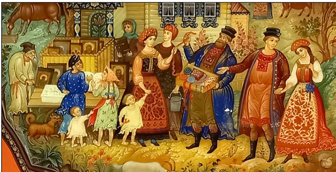
Рис. 12. Борисова В.Ю. Панно «Мстерские офени», фрагмент. Мстерская лаковая миниатюра. 2002 г. Мстерский художественный музей

Из всего вышесказанного можно сделать вывод, что стилизация фигур не только не противоречит анатомической достоверности, но опирается на нее, используя для усиления выразительности персонажей. Миниатюра может создавать свой неповторимый сказочный мир, преображая формы и пропорции фигур, или воспроизводить реальность, но знание пластической анатомии всегда лежит в основе любого изображения фигуры человека.