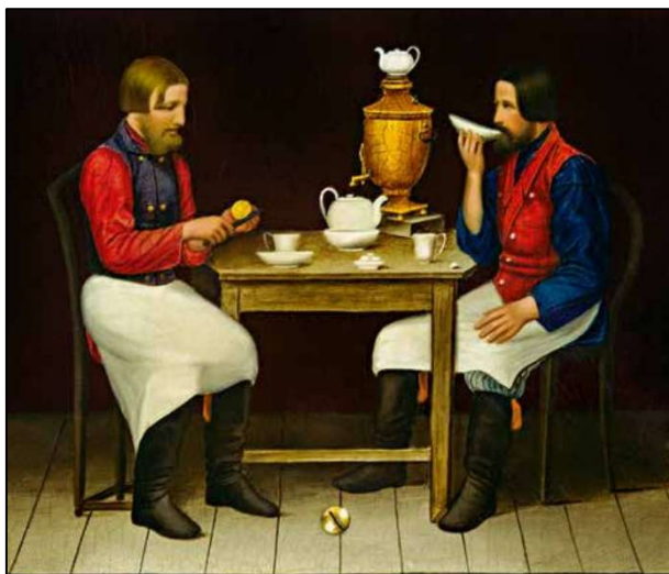
Рис. 1. Шкатулка «Чаяпитие», фрагмент. Фабрика А.П. Лукутина. Федоскинская лаковая миниатюрная живопись. Вторая половина XIX в.

Палеха, Мстеры, Холуя. Стилизация изображения человека и анатомическая достоверность – насколько они совместимы, не противоречит ли одно другому?