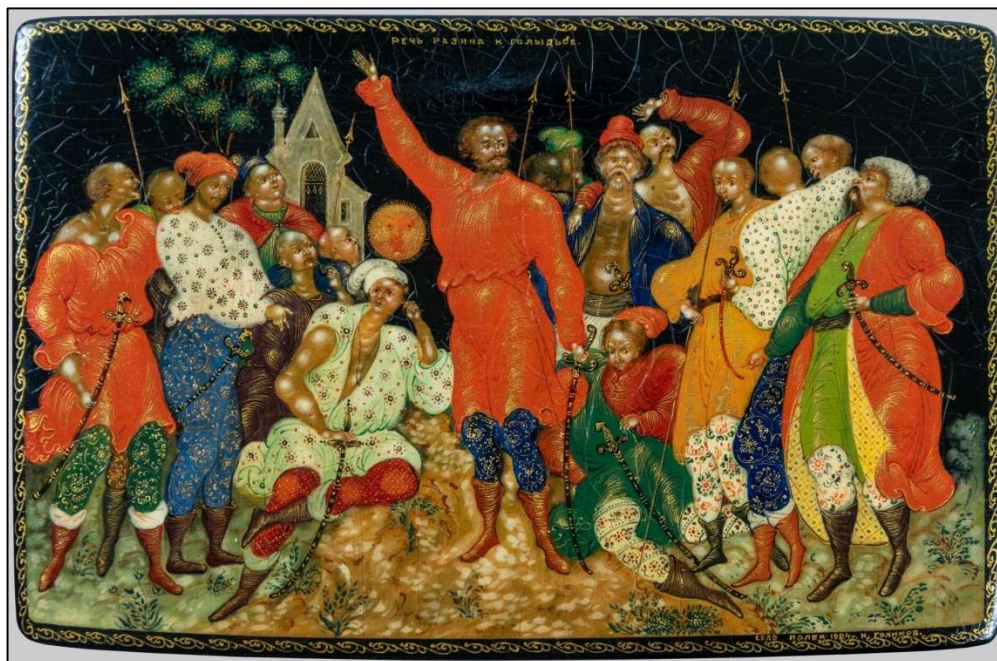
Рис. 8. И.И. Голиков. Панно «Речь Стеньки Разина к голытьбе».

Обратим внимание на фигуру в красном одеянии, стоящую слева (рис. 9). Мы видим обнаженный плечевой пояс, изображенный в стилистике лаковой миниатюры Палеха, но анатомически корректный. В изображении ясно определены дельтовидная, трапециевидная, большие грудные мышцы, ключица, угадывается акромиальный отросток лопатки, грудинно-ключично-сосцевидная мышца, гортань и т.д., их форма и размеры изменены, они декоративно переработаны и стилизованы.