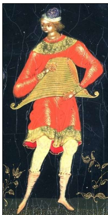
Рис. 3. И.И. Голиков. Шкатулка. «Музыканты», фрагмент. Палехская лаковая миниатюра. 1924 г. Государственный музей палехского искусства

В мстерской миниатюре тенденция удлинения фигур сохраняется в некоторых сюжетах, но в основном пропорции изображения более приближены к реальным (рис. 4 70 ). В том числе пропорции, связанные с возрастными особенностями человека. Так, например, в миниатюре «Мстерская мадонна» В.Ф. Некосова пропорции головы к росту ребенка 1:5, что соответствует реальным пропорциям трехлетнего возраста (рис. 5). Также реалистичны и другие соотношения частей тела.