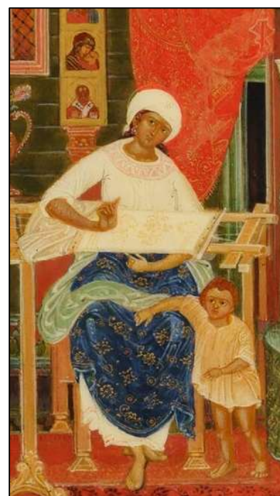
Рис. 5. В.Ф. Некосов. Панно «Мстерская мадонна», фрагмент. Мстерская лаковая миниатюра. 2008 г. Мстерский художественный музей

В лаковой миниатюрной живописи Холуя изображения фигур наиболее реалистичны и пропорции приближены к фактическим соотношениям частей тела человека.