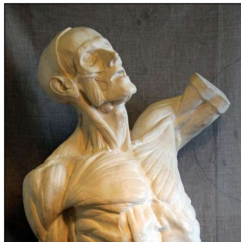
Рис. 10. Анатомическая модель «Мюнхенский торс» (экорше)

Кисти рук в миниатюре также анатомически достоверны: переданы косточки запястий, фаланги пальцев, мышечные возвышенности ладоней, точно передана экспрессивная пластика жестов (рис. 11).