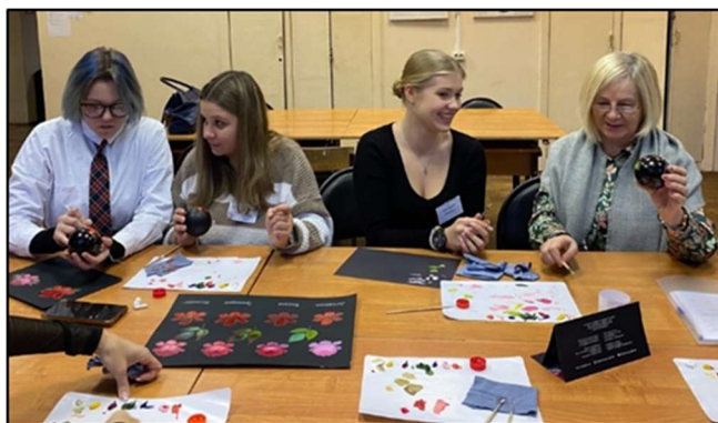
Рис. 7. Мастер-класс «Изображение цветов в многослойной технике жостовской художественной росписи». 2024 г.

Коллективом Федоскинского института лаковой миниатюрной живописи был подготовлен и опубликован каталог «Традиционные художественные промыслы Московской области», который объединил три вида традиционного прикладного искусства: жостовскую художественную роспись, федоскинскую лаковую миниатюрную живопись и богородскую художественную резьбу по дереву [11]. Многие работы из фондов Федоскинского института лаковой миниатюрной живописи и Богородского