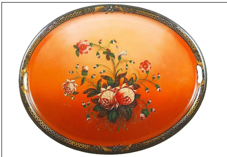
Рис. 2. Поднос «Букет в раскидку». 1880-е гг. Мастерская О.Ф. Вишнякова с сыновьями

В 1922 г. в деревне Новосельцево образовалась «Новосельцевская трудовая артель», выпускавшая железные лакированные подносы; в 1924 г. в деревне Жостово открылись «Жостовская трудовая артель» и «Спецкустарь»; в 1925 г. – «Лакировщик», одновременно в селе Троицкое – артель «Свой труд». Все они вошли в 1928 г. в объединенную специализированную артель «Металлоподнос», которая в 1960 г. была преобразована в Жостовскую фабрику декоративной росписи [3, с. 11].