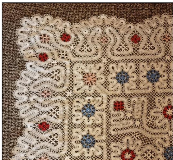
Рис. 4. Фрагмент накидки на подушки.

В ходе плетения части кружевного изделия студенты освоили технологию введения в работу цветной нити для выполнения заполнений.