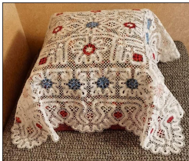
Рис. 5. Накидка на подушки. 100×100 см

Реновация киришского кружевного изделия выполнена группой обучающихся среднего профессионального обучения. 2023 г. Преподаватель: Ю.Е. Лапина