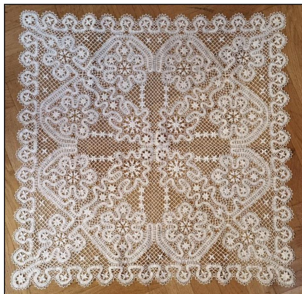
Рис. 2. Ю.Е. Лапина. Накидка на подушки. 85×85 см. Реновация. 2006 г. Высшая школа народных искусств (академия). Киришское художественное кружевоплетения

В первом семестре обучающиеся изучают технологию киришского кружевоплетения, теоретические знания применяют при выполнении учебных образцов, которые складываются из определенных приёмов плетения: «перевить» и «поменять». Эти приёмы плетения создают основные переплетения: «полный заплет», «полный оплет булавки», «закидка», выполняющиеся в определенной последовательности, а также