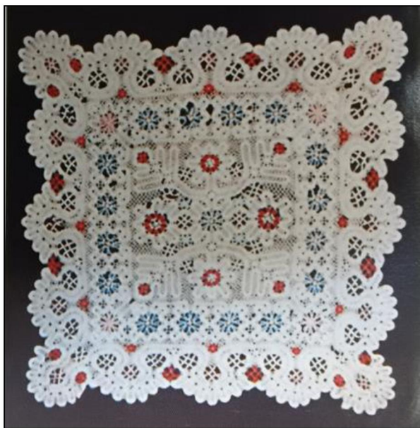
Рис. 3. Маркова Л.Н. Накидка на подушки. д. Иконово. 1960-е гг.

технологического приёма «сцепка». Во втором семестре обучающиеся закрепляют навыки при выполнении небольших по размеру кружевных изделий и крупную коллективную кружевную работу.