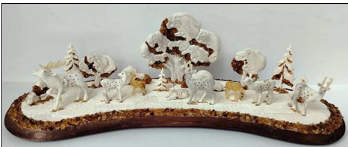
Рис. 1. В. Малышев Скульптурная композиция «Олени в осеннем лесу». 2023 г. Руководитель: В.Н. Колобов

На рисунке 1 18 представлена скульптурная композиция «Олени в осеннем лесу», выполненная с применением нетрадиционного для косторезного искусства поделочного материала – янтаря. Многофигурные скульптурные композиции не являются широко распространенными в холмогорском косторезном искусстве, преобладающую роль играют ажурные изделия, но в конце XVIII – начале XIX века многие холмогорские мастера выполняли скульптурные композиции макетного типа. Например, настольное украшение «Стоянка ненцев», изображающее сцены из жизни ненцев в тундре представлен на рисунке 2 19 .