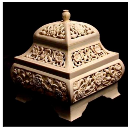
Рис. 5. Борминская С. Ажурная шкатулка «Маки в летнем саду». 2018 г. Руководитель: В.Н. Колобов

Декоративное вращающееся панно «Город Петра» (рис. 6) с изображением Петра I в центре композиции олицетворяет образ основателя Санкт-Петербурга. Вокруг профиля Петра I, между двух орнаментальных полос, изображены архитектурные достопримечательности, являющиеся историческим достоянием города на Неве. На переднем плане выполнены архитектура и памятники, на заднем изображено небо.