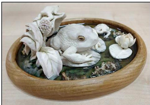
Рис. 4. В. Малышев Скульптура «Земноводные». 2019 г. Руководитель: В.Н. Колобов

Шкатулка «Маки в летнем саду» (рис. 5) имеет оригинальную форму и многочисленные ажурные орнаментальные вставки с цветочными мотивами. Конструкция не имеет «глухого» деревянного каркаса, что позволяет свету проникать сквозь изделие, придавая ему легкость и хрупкость. Главными элементами орнаментальной композиции являются маки, символизирующие плодородие, женское очарование и молодость. Узоры в композиции выполнены без традиционных для холмогорского стиля элементов «северного рококо», однако декоративное фактурирование основывается на канонических принципах.