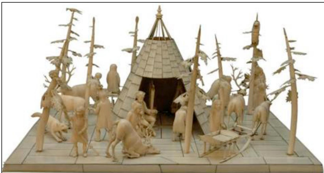
Рис. 2. Декоративное настольное украшение «Стоянка ненцев». Конец XVIII в. Холмогоры

В скульптурной композиции «Райский сад» (рис. 3) в декоративном решении использованы крупные ажурные элементы, создающие образ деревьев и кустарника, выполненные из рога лося, а также мелкие ажурные детали хвостов павлинов. Качество выполнения ажурной техники – характерной черты холмогорского косторезного искусства – зависит от используемого поделочного материала. Для мелкого ажюра чаще всего используется цевка, а пористая структура рога лося больше подходит для крупной сквозной резьбы. Декоративное решение листвы крон деревьев выполнено в классических традициях и встречается во многих произведениях холмогорских мастеров, как в рельефных, так и ажурных. Новизна же заключается в гармоничном сочетании крупных и мелких форм ажурной резьбы в многофигурной скульптуре, позволяющей гармонично сочетать декоративные объекты и элементы между собой.