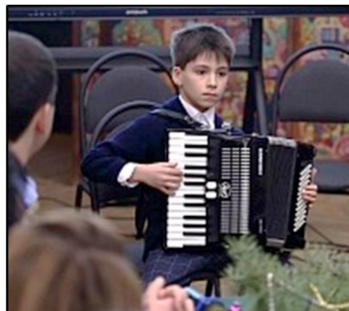
Рис. 4, 5. Музыкальное приветствие учащиеся Детской школы искусств № 8» г. Сергиев Посад

Доклады на пленарном заседании были посвящены различным аспектам игрушки как инструмента поддержки традиционных ценностей и патриотического воспитания детей и молодежи. В.Ф. Максимович отметила значение Художественно-педагогического музея игрушки им. Н.Д. Бартрама как части стратегии Высшей школы народных искусств (академии). Т.В. Буцкая, депутат Государственной Думы, первый заместитель председателя Комитета Государственной Думы по защите семьи, вопросам отцовства, материнства и детства познакомила участников конференции с мерами поддержки традиционных российских семейных ценностей, отметив значение игрушки, рассказала о разработке ГОСТа психолого-педагогической экспертизы современных игрушек.