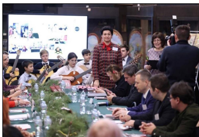
Рис. 2. Открытие XVI Международных Бартрамовских чтений

Международные Бартрамовские чтения, статус которых был подтвержден участниками из зарубежных государств: Республики Беларусь, Япония и Сингапур. Тема конференции «Игрушка: прошлое, настоящее, контуры будущего» (рис. 1-2 7 ). Участники Бартрамовских чтений получили возможность осмыслить опыт прошлого, сформулировать современные проблемы создания и развития игрушек и наметить пути, по которым будет дальше развиваться профессиональное образование в этой сфере, обсудить вопросы изучения, экспонирования, хранения и реставрации музейных предметов.