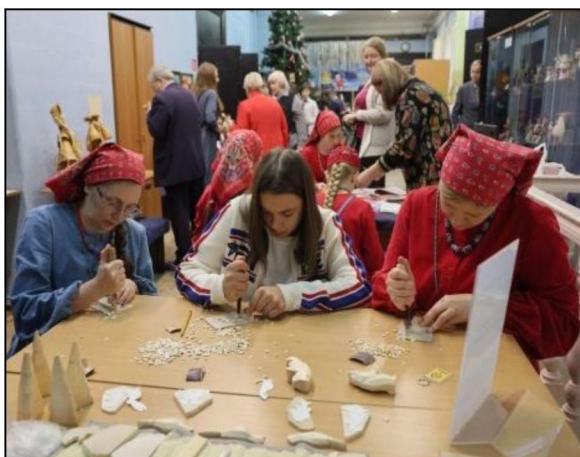
Рис. 7. Мастер мастер-классы по изготовлению традиционной богородской игрушки

В рамках Международных XVI Бартрамовских чтений были проведены мастер-классы по изготовлению традиционной богородской игрушки, игрушек из текстиля и бумаги и др. (рис. 7) Участники чтений могли посмотреть временные выставки «Семья – сила России», выставки игрушек фабрики «Русский стиль Подмосковья» (г. Хотьково) и «Многоликая береста» музея «Живое дерево» (г. Новосибирск), а также выпускные квалификационные работы студентов высшего образования Сергиево-Посадского института игрушки – реновации игрушек из коллекции Художественно-педагогического музея игрушки им. Н.Д. Бартрама (рис. 8).