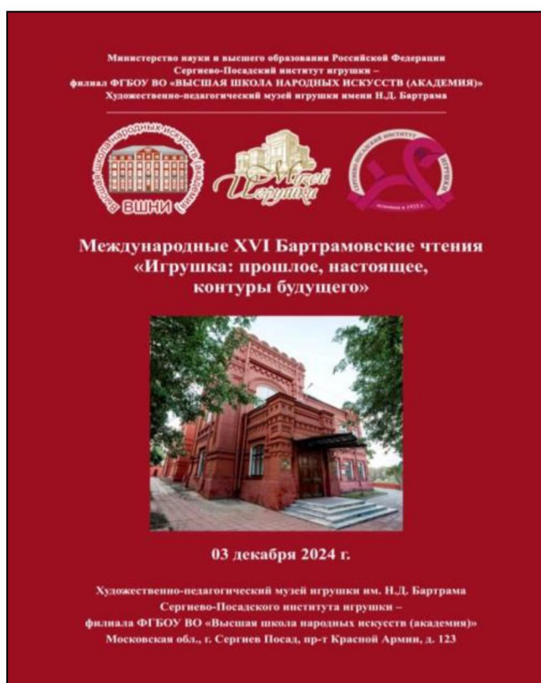
Рис. 1. Афиша XVI Международных Бартрамовских чтений

Keywords: International XVI Bartram's Readings, toy, toy design, professional education, Art and Pedagogical Toy Museum named after N.D. Bartram. N.D. Bartram.