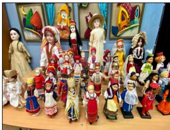
Рис. 8. Выставка выпускных квалификационных работ студентов Сергиево-Посадского института игрушки

Международные XVI Бартрамовские чтения в Сергиевом Посаде стали дискуссионной площадкой, рассматривающей вопросы развития российской игрушки в изменившейся социокультурной парадигме, собравшей представителей разных сфер деятельности.