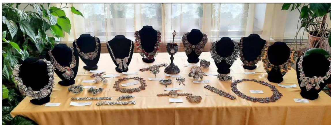
Рис. 2-6. Выставка произведений традиционных художественных промыслов, выполненная студентами Высшей школы народных искусств (академии)