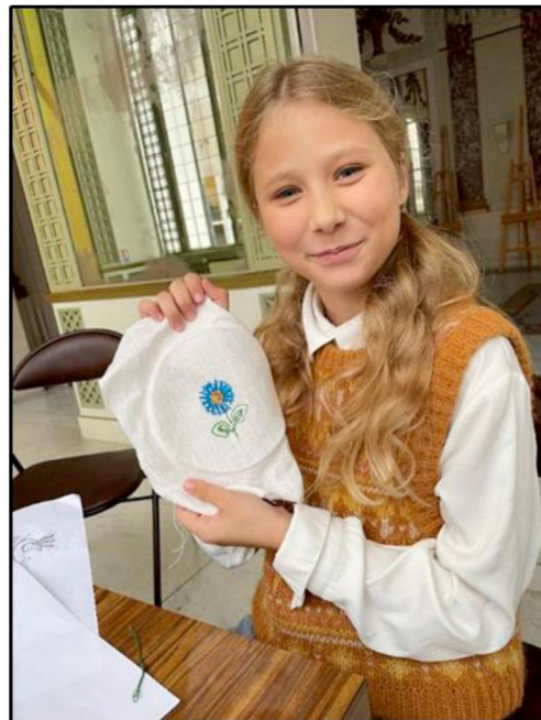
Рис. 4, 5. Мастер-класс по вышиванию василька в технике «цветная гладь»