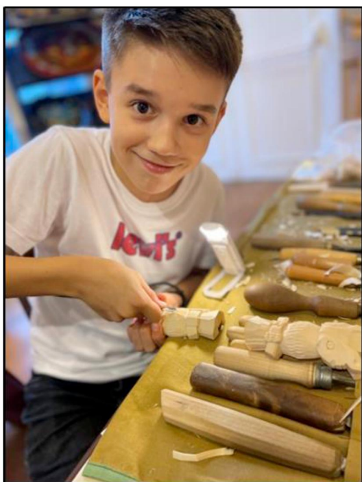
Рис. 6. Мастер-класс по созданию стамеской деревянной заготовки совы с подвижными деталями

Особый интерес вызвали мастер-классы по богородской резьбе по дереву (рис. 6, 7), где на обрубленной заготовке фигуры медведя необходимо было отразить внешний реалистичный вид готового образца – голову (глаза, уши, нос, рот), передние и задние лапы и, конечно, мех. Каждый с радостью уносил созданного медведя – красивого, умного, смелого – как символ России. А один подросток вообще создал самолёт с медведем за штурвалом.