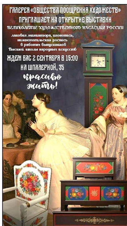
Рис. 1. Плакат выставки «Великолепие художественного наследия России»

Выставки являются одними из самых интересных коммуникативных средств, стимулом для развития творческой деятельности.