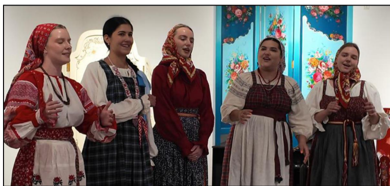
Рис. 3. Вокальный ансамбль «Самоварочки»

Частью праздничного открытия стало выступление петербургского фольклорного ансамбля «Самоварочки».