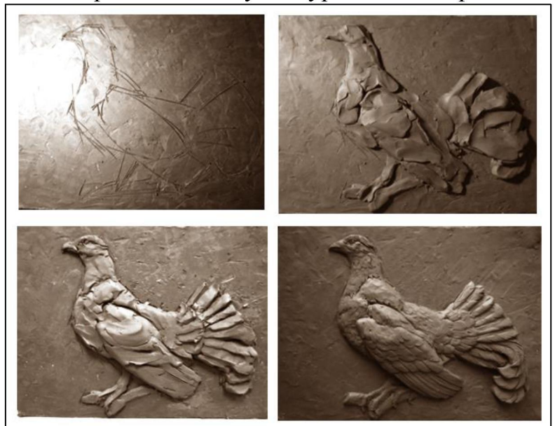
Рис. 16. Рельеф птицы. Этапы выполнения работы

Так в построении рельефа птицы на плоскости скульптурными приемами уплощения и последовательного распределения конструктивных планов решается задача восприятия рельефа как реального объёма с характеристиками круглой скульптуры. При этом создаётся иллюзия пространства, находящегося за пределами скульптурного изображения благодаря выстраиванию планов параллельно плоскости фона и сохранения высоты рельефа по всему контуру силуэта птицы. Для усиления эффекта объёмности участки ближнего плана объекта прорабатываются подробнее последующих планов (рис. 16). Этот приём применяется в создании ювелирных изделий, где восприятие высоты рельефа усиливается также благодаря противопоставлению рельефных фактур зеркально отполированных, фактурам матовым, фоновым. Нередко, скульптурные приемы комбинируются с техниками декора поверхности ювелирных изделий, например, оксидирование, при котором серебряные изделия обрабатываются специальным составом, основным ингредиентом которого, является сера. Вследствие этой обработки, материал приобретает