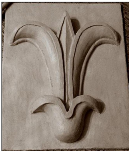
Рис. 5. А. Гатиева. I курс. Копия гипсовой растительной розетки

Особый акцент в обучении академической скульптуре делается на умении изображать растительные и цветочные мотивы (рис. 5, 6), поскольку эти темы одни из самых распространённых и часто используемых в ювелирном искусстве (рис. 7).