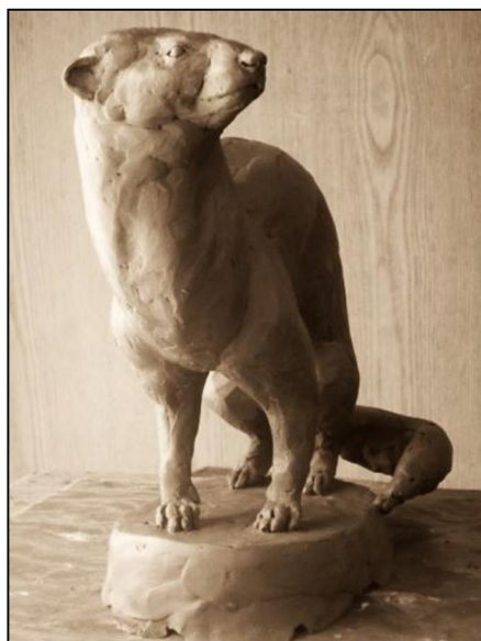
Рис. 8. Зосимов А. I курс. Объёмное изображение животного

рельефа. Композиция в работе выстраивается от центральной точки. Это задание самое первое в программе академической скульптуры и пластического моделирования. Оно представляет собой вводный этап формирования понимания отличия графического изображения от рельефного. В поэтапном процессе изучаются основные принципы построения объёмного рельефа с растительной формой. В результате работы с моделью, развиваются навыки и умение через форму и её характер, передавать особенности образа.