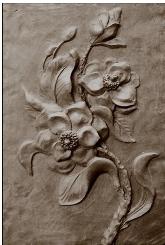
Рис. 2. Солопова А. I курс. Рельефное изображение цветов

Цель дисциплины – в овладении способами ваяния и лепки, изучении стадий скульптурной работы: от создания каркаса до нанесения декоративных фактур, овладении техниками и способами конструктивного построения рельефных (рис. 2) и объемных изображений (рис. 3).