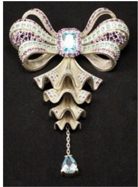
Рис. 14, 15. Рыбалко Е. Броши «Банты». Выпускная квалификационная работа. 2019 г.

Так в построении рельефа птицы на плоскости скульптурными приемами уплощения и последовательного распределения конструктивных планов решается задача восприятия рельефа как реального объёма с характеристиками круглой скульптуры. При этом создаётся иллюзия пространства, находящегося за пределами скульптурного изображения благодаря выстраиванию планов параллельно плоскости фона и сохранения высоты рельефа по всему контуру силуэта птицы. Для усиления эффекта объёмности участки ближнего плана объекта прорабатываются подробнее последующих планов (рис. 16). Этот приём применяется в создании ювелирных изделий, где восприятие высоты рельефа усиливается также благодаря противопоставлению рельефных фактур зеркально отполированных, фактурам матовым, фоновым. Нередко, скульптурные приемы комбинируются с техниками декора поверхности ювелирных изделий, например, оксидирование, при котором серебряные изделия обрабатываются специальным составом, основным ингредиентом которого, является сера. Вследствие этой обработки, материал приобретает