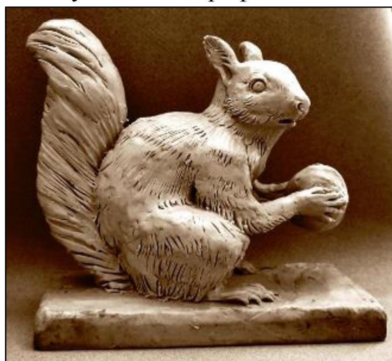
Рис. 3. Мыльцын Н. I курс. Объемное изображение животного

Большую часть профессиональных знаний студентам дает академическая скульптура. Практические занятия с натурными объектами формируют объемно пространственное мышление, дают возможность уйти от плоскостного восприятия окружающего мира. Выполнение объемных изображений помогает анализировать структуру и особенности характера формы модели, учит выявлять и подчёркивать её индивидуальные конструктивные особенности.