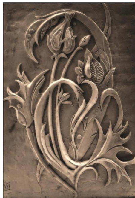
Рис. 12. Шавырин И. I курс. Декоративное рельефное изображение растительной композиции

В построении гармоничной композиции, как в академической скульптуре, так и в декоративной, необходимо придерживаться соразмерности целого и отдельных частей целого. Важно понимание масштаба, соразмерности формы и её элементов по отношению к окружающему пространству и другим формам [3, с. 7]. Соблюдение пропорций, масштабности, особой ритмической организации и взаимосвязи изобразительных элементов, играют важную роль в достижении выразительности декоративной композиции (рис. 12).