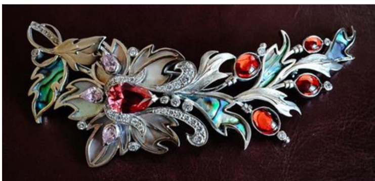
Рис 13. Ефремов Е. Брошь «Вишнёвый сад». Выпускная квалификационная работа. 2017 г.

Опыт разработок композиций и их создания на занятиях по декоративной пластике малых форм становится одним из главных источников концентрации идей, позволяющих применять их при проектировании разноплановых по тематике и назначению ювелирных