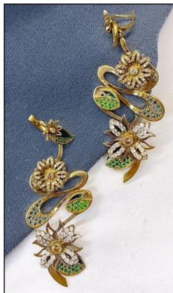
Рис. 18. А. Ом. Серьги. Семестровая работа. 2020 г

Современный период развития ювелирного искусства – это период дизайнерского начала и применение современных технологий. Современным художникам-ювелирам доступны технические новшества, которые позволяют воплощать в материале любые формообразующие конструкции. Но к каким бы темам не обращался художник, какие-бы материалы не использовал в своих изделиях, художественную ценность они обретают благодаря применению профессионального опыта, в основе которого лежат знания, полученные при