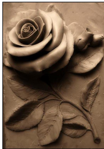
Рис. 6. И. Болкисев I курс. Лепка растений с натуры