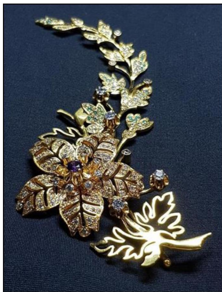
Рис. 17. Г. Галицын. Брошь «Цветочек». Семестровая работа. 2020 г.

Опыт разработки растительных и цветочных мотивов послужил материалом для проектирования и создания семестровых работ, представленных на рисунках 17-18. В стилизованном решении используется основное выразительное средство рельефа – развёртывание композиции на плоскости, в данном случае плоскость фона условна. При этом само изображение построено с передачей пространственных планов. На первом плане находятся цветы, на втором – размещены элементы листьев, выполненные в ажурной сквозной технике, и завершающим третьим планом становится искусно стилизованные ветви. Благодаря такой группировке частей композиции, выстроенных в определённом орнаментальном ритме, последовательно воспринимаются элементы изображения, что создаёт ощущение единства, структурной упорядоченности и целостности изделия.