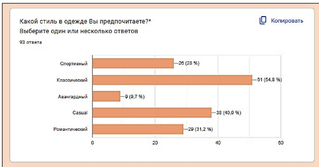
Рис. 3. Гистограмма результатов опроса потребителей

На вопрос «Хотели бы вы приобрести одежду с ручной вышивкой?» 80% респондентов ответили положительно (рис. 4).