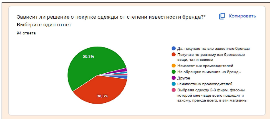
Рис. 2. Диаграмма результатов опроса потребителей

Обработка ответов дает возможность с некоторой осторожностью предположить, что приобретать изделия с вышивкой клиенты могут в крупных магазинах (46% опрошенных), более 55% респондентов не обращают внимания на бренд изделия.