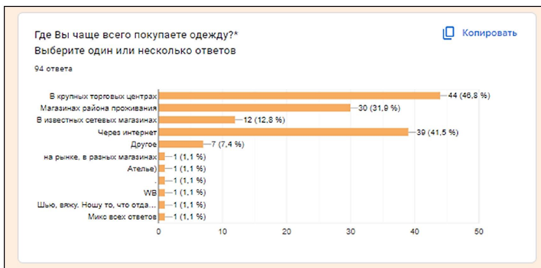
Рис. 1. Гистограмма результатов опроса потребителей

- диаграмма ответа покупателей на вопрос «Зависит ли решение о покупке одежды от степени известности бренда?» с подавляющими ответами покупателей о безразличии к брендам (рис. 2).