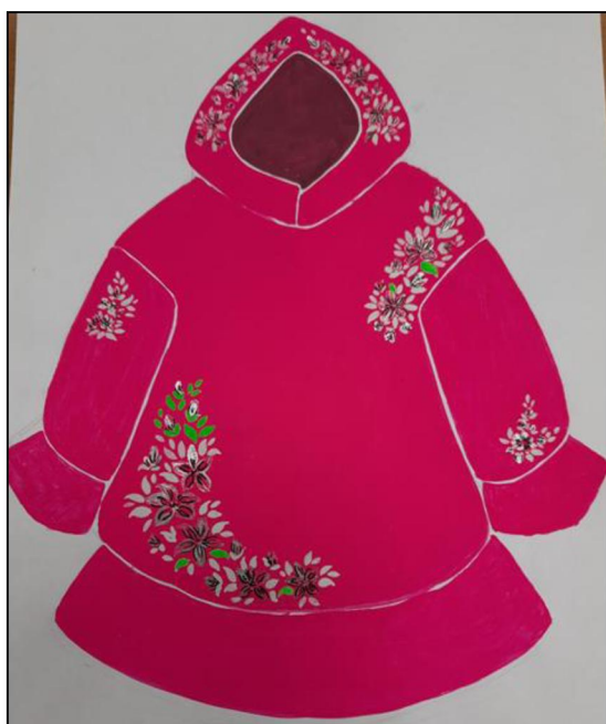
Рис. 7. Перфилова Х. Фор-эскиз худи

В настоящее время три выпускника работают по этим эскизам и уже готовят вышитые изделия для выпускной квалификационной работы (рис. 7, 8). Одна из идей получила творческую и технологическую переработку и превратилась в тонкую и кропотливую работу на стыке ручной и машинной вышивки (рис. 9, 10).