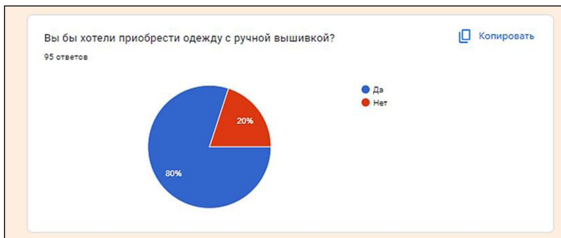
Рис. 4. Диаграмма результатов опроса потребителей

Ответы целевой аудитории на вопросы анкеты после их анализа позволяют создать портрет типичного покупателя традиционных художественных промыслов 2023 года. Как правило, для создания портрета используют вопросы четырех групп: демографические (возраст, пол), географические (регион проживания), социально-экономические (социальный статус, профессия, уровень образования) и психографические (ценности, привычки, проблемы).