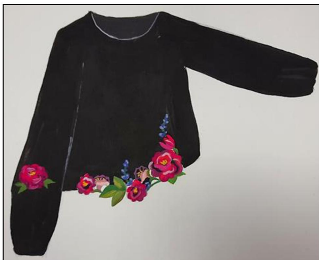
Рис. 9. Селютина Ю. Фор-эскиз худи

научно-технического прогресса и росту конкуренции на рынке традиционных художественных промыслов, наблюдается тенденция востребованности в специалистах способных самостоятельно вести свой бизнес.