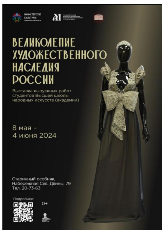
Рис. 1. Плакат выставки «Великолепие художественного наследия России»

Старинный особняк на Набережной Северной Двины в г. Архангельске является памятником архитектуры 1786 г. постройки. На первом этаже дома расположен красивый по своему архитектурному решению выставочный зал с анфиладами. Арочные проемы делят выставочное пространство на три части. Благодаря такой планировке успешно были экспонированы и разделены по направлениям традиционного прикладного искусства произведения, представленные Высшей школой народных искусств.