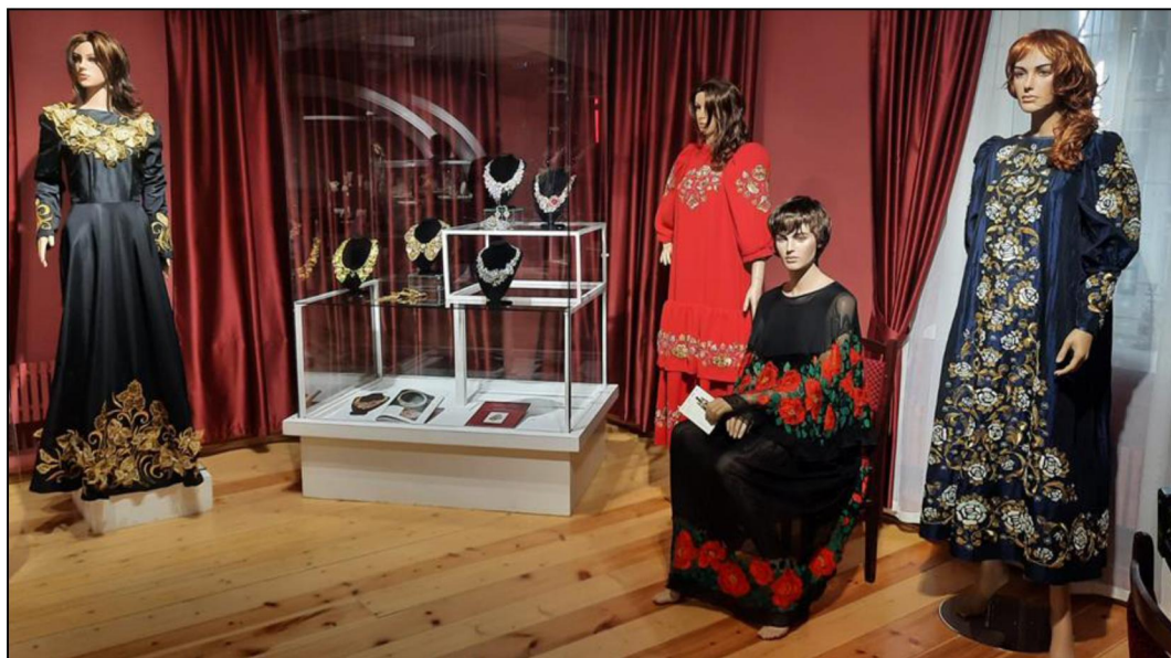
Рис. 4. Выпускные квалификационные работы студентов Высшей школы народных искусств (академии): платья с художественной вышивкой и ювелирные кольца

художественного наследия России» представлены и их выпускные квалификационные работы.