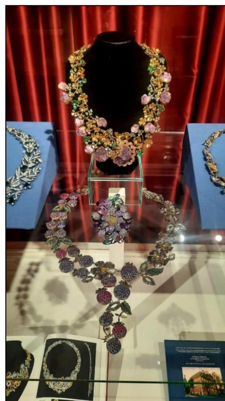
Рис. 5. Выпускные квалификационные работы студентов Высшей школы народных искусств: ювелирные кольца

Художественная вышивка демонстрирует богатые возможности технологического исполнения различных традиционных техник в новом решении: русской глади, ивановской строчки, золотного шитья. Например, на тончайшем прозрачном воздушном фатине раскиданы золотые лепестки лилий, выполненных металлизированной нитью, мохеровые пушистые нити в сочетании с шелком стелются поверх тончайшей обвитой вручную сетки (рис. 4). Красота композиционного решения и качество, доведенное до совершенства, заставляет задуматься: «Неужели это сделано руками человека?».