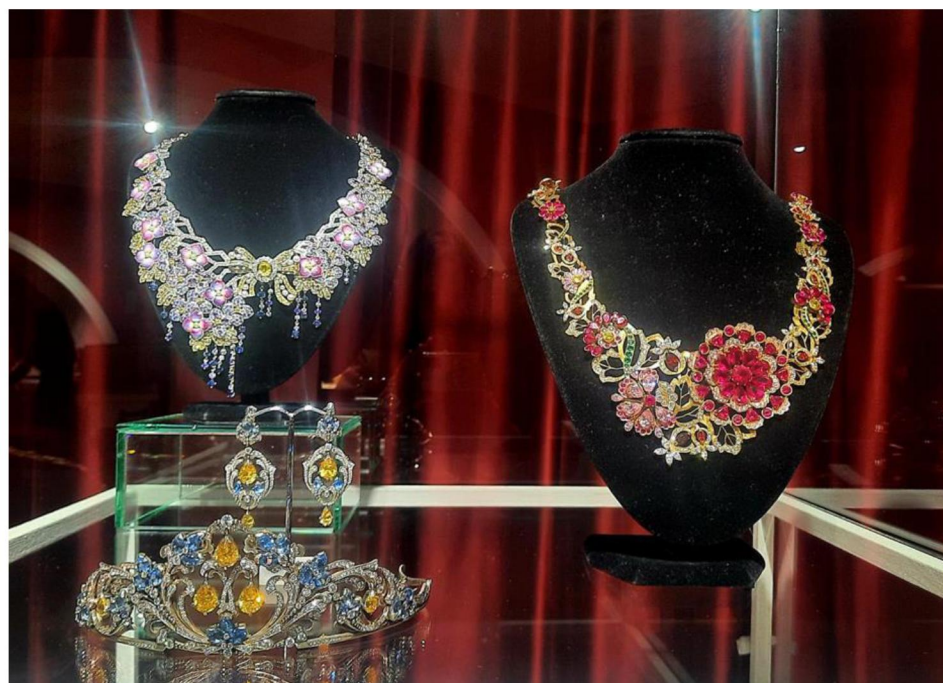
Рис. 8. Выпускные квалификационные работы студентов Высшей школы народных искусств: ювелирные кольца, серьги и диадема

Итоги выставки свидетельствуют о большой посещаемости, прекрасные отзывы посетителей (рис. 9), мастер-классы для детей, организованные сотрудниками музея в выставочном пространстве, творческие встречи и