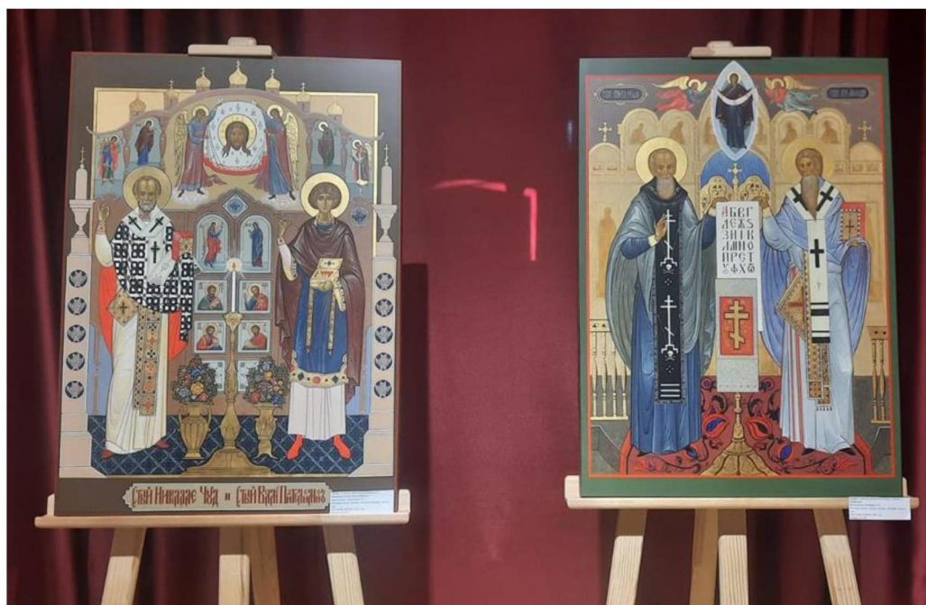
Рис. 7. Церковно-историческая живопись: иконы. Выпускные квалификационные работы студентов Мстерского института лаковой миниатюрной живописи им. Ф.А. Модорова – филиала Высшей школы народных искусств (академии)

иконописными канонами, держат центр выставочного пространства и заставляют вернуться к ним снова, цвет письма необычен, преобладание золота, охры с включением синего и голубых тонов – это редкость.