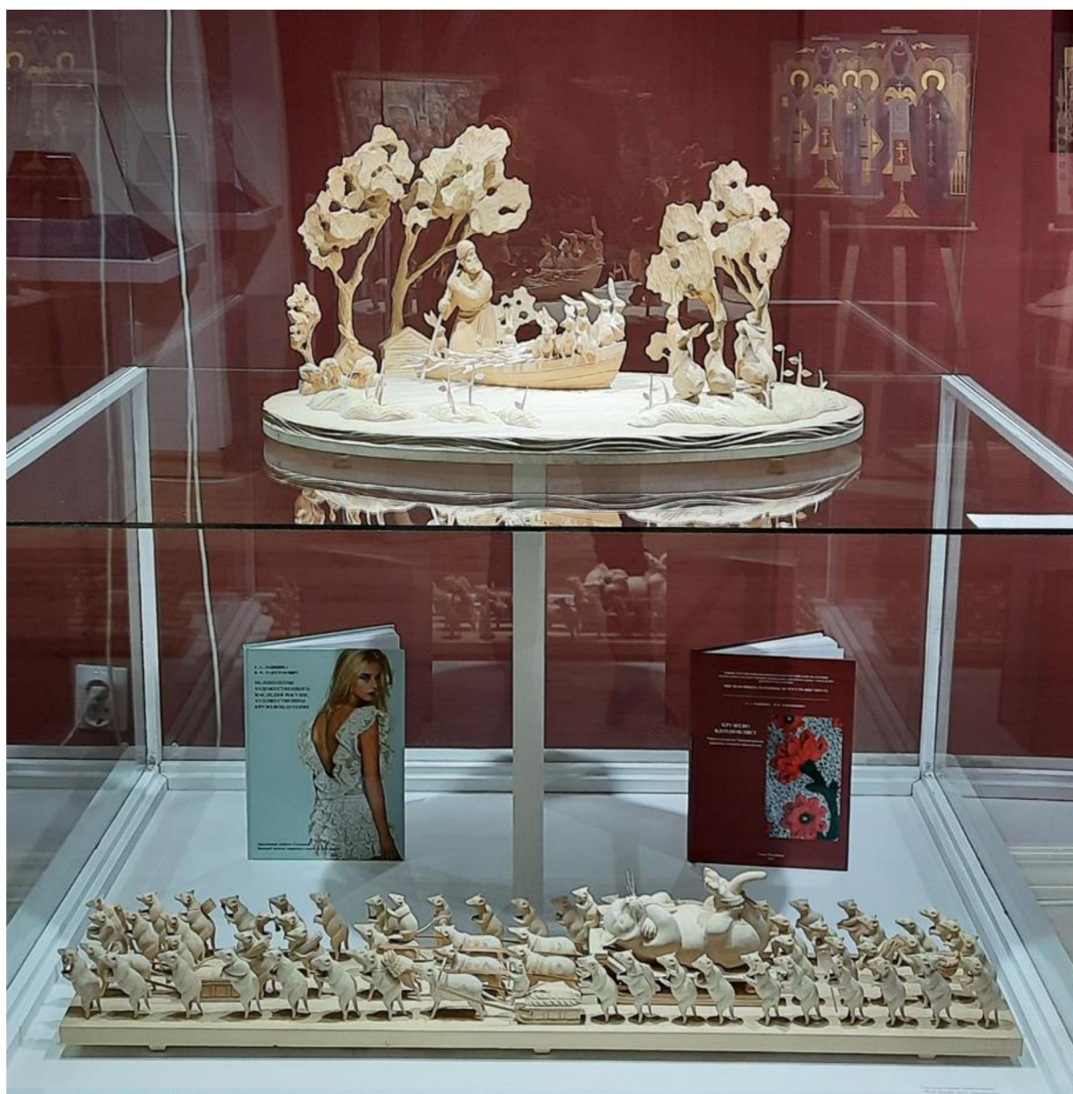
Рис. 6. Выпускные квалификационные работы: скульптурные композиции «Дед Мазай и зайцы» и «Как мыши ката хоронили». Богородская художественная резьба по дереву

Богородская художественная резьба по дереву представлена уникальными скульптурными многофигурными композициями: «Как мыши ката хоронили», «Дед Мазай и зайцы» (рис. 6), «Большой улов» и др. Профессионализм исполнения каждого экспоната предлагает задержаться и долго рассматривать каждый элемент. Скульптурная резьба по дереву считается самой сложной, т.к. изображение фигуры человека или животного требует от художника пространственного мышления, умения чувствовать пропорции и перспективу.