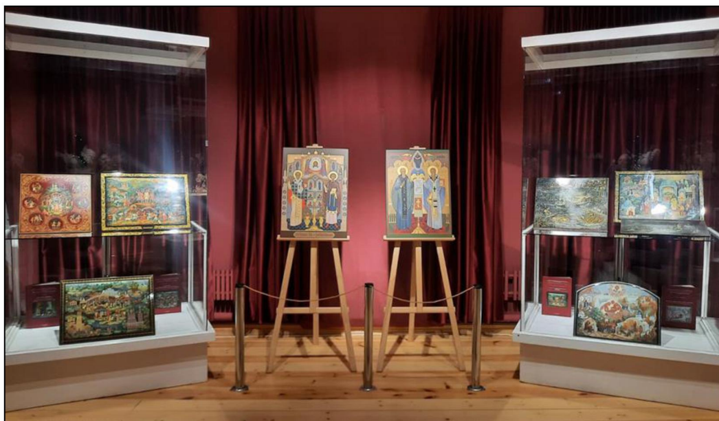
Рис. 2. Центральная часть экспозиции выставки «Великолепие художественного наследия России» в г. Архангельск