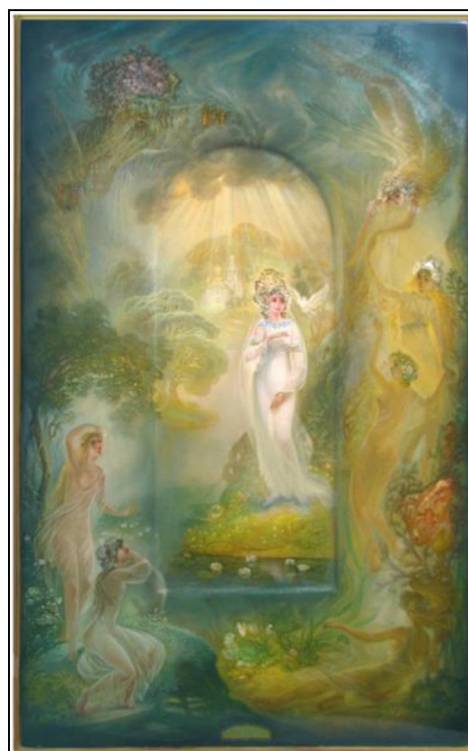
Рис. 9. О.В. Головченков. Панно «Царевна Волхова». 2000 г.

Центральной фигурой композиции является прекрасная царевна Волхова. Лёгкая и грациозная фигурка девушки расположена в арке, которая символически показывает переход царевны из мира подводных жителей в мир людей. Царевна, полюбив Садко, решила уйти жить на землю к людям. Она стоит на берегу в лучах солнечного света, сияющий, искрящийся белый цвет платья притягивает внимание. В этом наряде она выглядит как невеста. В левом верхнем углу композиции расположен образ Морского царя. В этом образе через детали художнику удалось соединить властное, жесткое начало