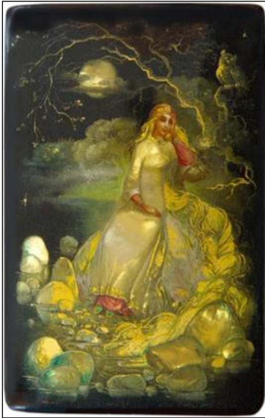
Рис. 6. О.В. Головченков. Шкатулка «Золотой Волос». 1989 г.