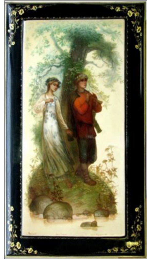
Рис. 7. О.В. Головченков. Панно «Лель и Снегурочка. 1992 г.

Панно «Лель и Снегурочка», ларец «Русалка» (рис. 8) представлены в постоянной экспозиции Музея-усадьбы Лукутиных [17, с. 97]. Работа «Лель и Снегурочка» в 1990-е гг. стала образцом для копирования и тиражировалась на Федоскинской фабрике.