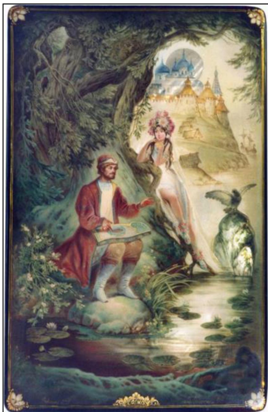
Рис. 10. О.В. Головченков. Панно «Садко». 2001 г.

правителя, который привык повелевать всеми, с нежным образом любящего отца, чувствительного и ранимого. Обрамляют композицию фигуры русалок.