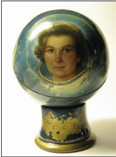
Рис. 4. О.В. Головченков. Сфера на подставке «В.В. Терешкова». 2016 г.

обращаться и позже: шкатулка «М.И. Кутузов», 2012 г.; сфера на подставке «В.В. Терешкова», 2016 г. (рис. 4); шкатулка «Петр I», 2022 г. (рис. 5) и др.