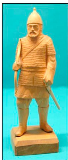
Рис 6. А.Я. Чушкин. Деревянная скульптура «Витязь». Нач. XX в.

К 100-летию юбилею Отечественной войны 1812 г. А.Я. Чушкин «...создает серию композиций, посвященных памятной дате. По этим работам можно проследить основные события наполеоновских кампаний в России» [4, с. 11] (рис. 7, 8). «Расцвет русской игрушки совпал с эпохой так называемой “отечественной войны”. Война и армия были в центре общественной жизни» [6, с. 63]. Поэтому не случайно обращение к этой теме вновь произошло спустя сто лет.