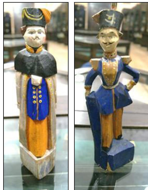
Рис 1, 2. Деревянные игрушки «Гусар». Сергиевский посад. Первая пол. XIX в

Еще один вид военной игрушки, являющийся и богородской, и сергиевской классикой – всадники на конях (рис. 3, 4). Очень часто они изображают вполне конкретных исторических личностей. Примером может