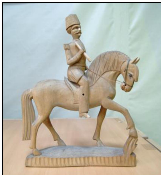
Рис. 3, 4. Деревянные скульптуры «Всадник». с. Богородское. XIX в.

Самым распространенным и простым был всадник в круглом головном уборе с обобщенно выполненным лицом и мундиром.