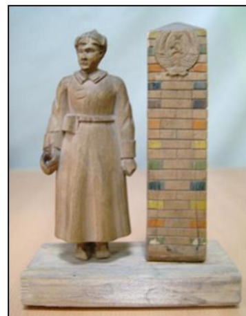
Рис. 10. И.К. Стулов. Пограничник. 1930-е гг.