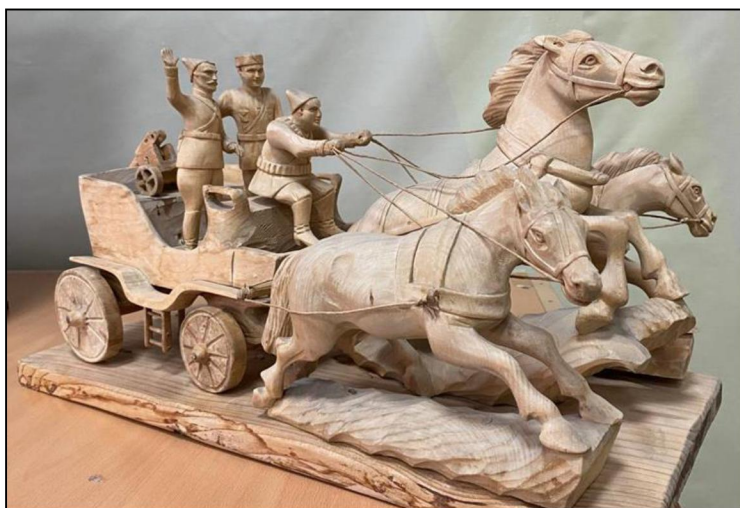
Рис. 11. М.А. Пронин. Скульптурная композиция «Тачанка». 1930-е гг.

В 1934 г. На экраны советских кинотеатров выходит художественный фильм «Чапаев». С этого момента «Чапаевская тачанка» (рис. 11) значительно потеснила на промысле традиционные богородские «выезды» – пары, тройки. В работе «Художественные промыслы Подмосковья» Н. Соболевский писал: «Замечательна “Чапаевская тачанка” ...стоящие в рост на