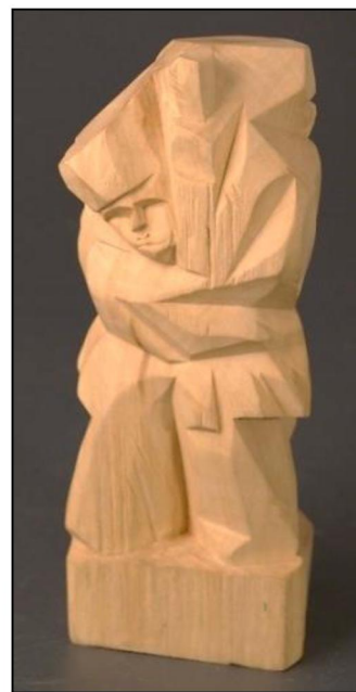
Рис. 12. А.Н. Варганов. Деревянная скульптура «Встреча». 1980-е гг.

В середине 1980-х гг. музейное собрание пополнилось интересными работами молодого резчика А.Н. Варганова – серией композиций на тему Победы (рис. 12). «Он совсем отказался от лепки в пластилине и начал резать в дереве, бережно сохраняя исходную форму трехгранного полена и природную красоту самого материала» [2, с. 190].