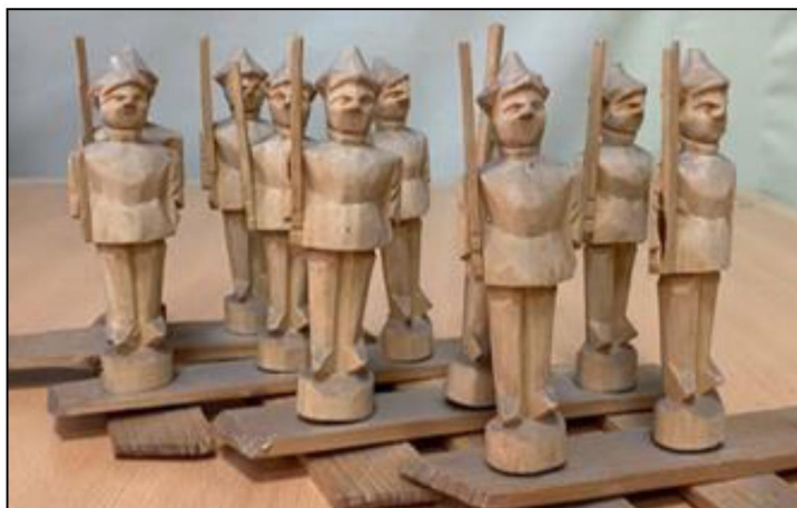
Рис. 9. Богородская деревянная игрушка «Красноармейцы» на разводе. с. Богородское. 1930-е гг.

Появляются многофигурные композиции и отдельные фигуры красноармейцев: кавалеристов, пограничников, охраняющих рубежи Советской Родины (рис. 9, 10).