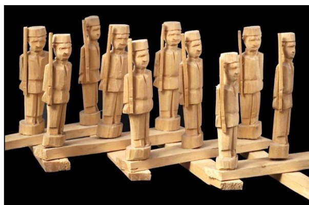
Рис. 5. Богородская деревянная игрушка «Солдатики» на разводе. с. Богородское. XIX в.

Огромной популярностью пользовались на российском рынке солдатики: небольшие по размеру фигурки 6-12 см высотой: конные и пешие, в одиночку и на разводах (рис. 5). Таких солдатиков стали делать мастера Сергиевского посада и с. Богородское во второй половине XIX в. «Остроумную конструкцию развода заимствовали из немецкой кустарной игрушки, называемой «ножницы». Если германские «ножницы» поражают миниатюрностью и точностью одинаковых токарных фигурок, то русские разводы – мощный виртуозной резьбой, где каждая фигурка – характер. ...От того, в какой последовательности соединены планки, зависит характер движения и построения фигурок» [3, с. 142].