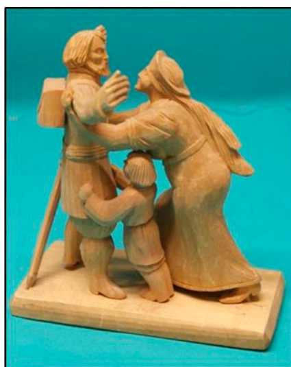
Рис. 7. А.Я. Чушкин. Скульптурная композиция «Встреча ополченца». 1910–1912 гг.