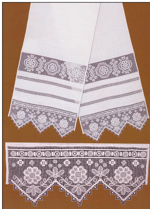
Рис. 4. Новожилова Н.М. Свадебное полотенце «Хрустальное». Цветная «ведновская строчка» в сочетании с белой «росписью». 1988 г.

Мотивы ведновской строчки просты: ромбы, иногда встречается цветочная розетка. В конце XIX – начале XX вв. в изделиях появились