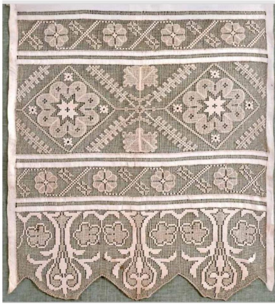
Рис. 1. Образец вышивки «Белая строчка» на переднике-завеске. Село Ягодное (деревня Арсёновка) Данковского уезда Рязанской губернии. Конец XIX – начало XX века. Липецкий музей народного и декоративно-прикладного искусства