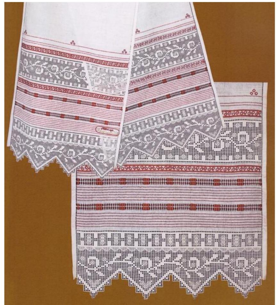
Рис. 2. Новожилова Н.М. Свадебное полотенце «Орнаментальное». «Ведновская строчка» в сочетании с цветными продержками, мережками и росписью. 1988 г.

В северных областях была известна не только белая строчевая вышивка, но и строчка с цветным контуром мотивов («строчка с цветной обводкой») и цветным заполнением внутреннего пространства орнаментальных фигур (в этих случаях основная сетка под фигурами белой нитью не перевивалась).