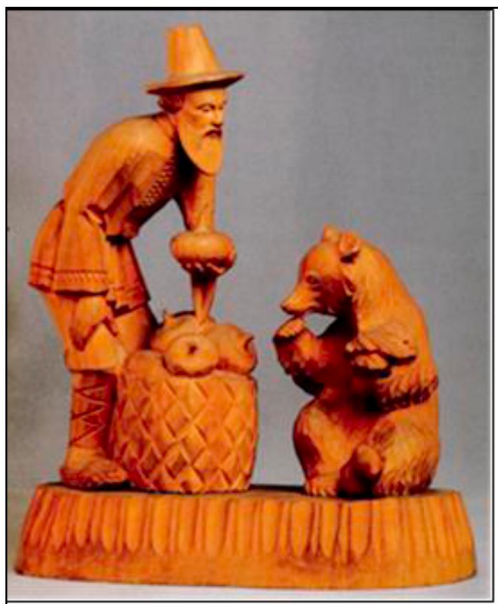
Рис. 2. И.К. Стулов. Скульптурная композиция «Вершки и корешки». 1944 г.

1930–1950-х гг. мастера все же начинают заниматься поиском новых форм, однако и в этом случае учитывают понятие народной красоты и гармонии.