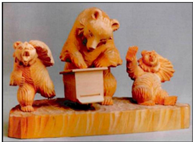
Рис. 4. М.В. Барашков. Скульптурная композиция «Медведь на пасеке». 1979 г.

В.Я. Дворников, Л.С. Журавлева, С.Н. Уласевич. Достойное место вновь обретает игрушка с движением, новые образцы которой постоянно разрабатывают мастера и художники промысла (рис. 4 9 ) [7, с. 57].