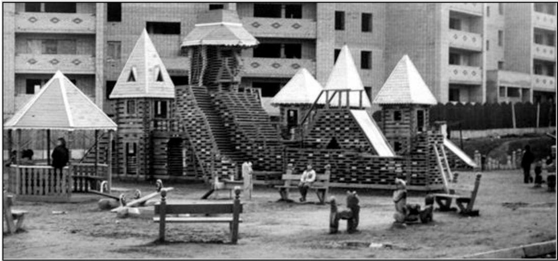
Рис. 5. Н.Н. Скотников и его ученики. Детская площадка «Городок». 1987 г.

Примечательным здесь является и тот факт, что даже в таких, казалось бы, далеких от резьбы делах, пригождались навыки, умение и смекалка будущих и действующих мастеров. Так, например, известен один интересный исторический факт о том, что в целях строительства очередной такой площадки материалы на строительство детских городков выделяла Загорская гидроаккумулирующая электростанция на реке Кунье у посёлка Богородское. Предполагалось, что городки будут строиться из широкого бруса, но в результате привезли узкий и тонкий материал. Мастер с учениками, включив творческую фантазию,