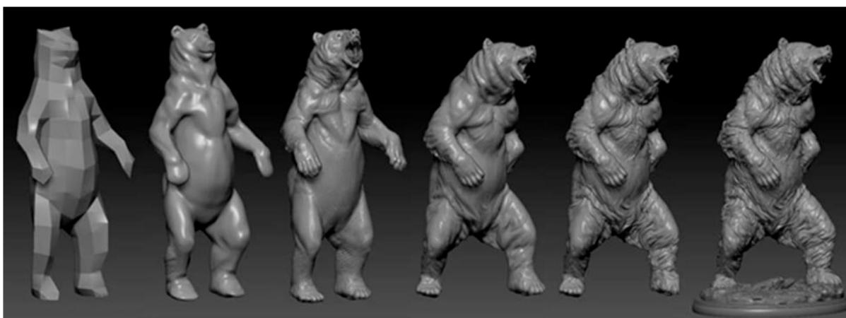
Рис. 8. Работа художника, выполненная в программе для 3D моделирования ZBrush

важные концептуальные основания современных методов обучения: осознанность работы, уход от механических действий путем внедрения в процесс обучения информационных технологий. В Богородском промысле с помощью станков с числовым программным управлением (ЧПУ) можно будет в дальнейшем быстро делать заготовки для скульптур и игрушек, сокращая процесс зарубки 13 и задолбки 14 , переходы сразу к крупным фаскам 15 и описке 16 . Уже сейчас в учебном процессе используется 3D-моделирование (рис. 8 17 ), позволяющее смоделировать изделие, которое будет воплощено позднее в резьбе, а также исправить недочёты, а потом приступить к лепке в пластилине или глине.