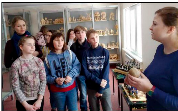
Рис. 7. Экскурсия для школьников в музее Богородского института резьбы по дереву

В филиале создан свой музей образцов и выпускных квалификационных работ выпускников (рис. 7 12 ), который является в настоящее время «живым» хранителем истории и наследия Богородского промысла, а также источником вдохновения для молодых резчиков, которое