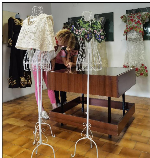
Рис. 6, 7. Посетители выставки «Великолепие художественного наследия России» рассматривают произведения, выполненные студентами Высшей школы народных искусств (академии)