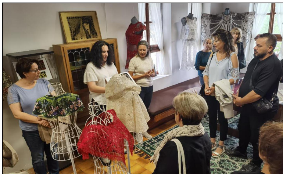
Рис. 5. Открытие выставки «Великолепие художественного наследия России» в зале Творческого центра «Калоферская дантела» (г. Калофер Болгария)

Посетители выставки внимательно рассматривали произведения, выполненные студентами академии в разных техниках кружевоплетения и вышивки, восхищались мастерством (рис. 6-10, 15).