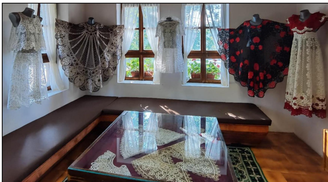
Рис. 4. Выпускные квалификационные работы студентов кафедры художественного кружевоплетения Высшей школы народных искусств (академии) на экспозиции выставки «Великолепие художественного наследия России»