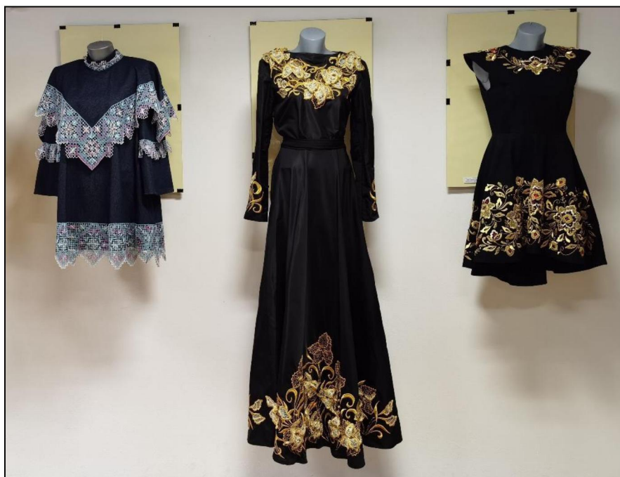
Рис. 3. Выпускные квалификационные работы студентов кафедры художественной вышивки Высшей школы народных искусств (академии) на экспозиции выставки «Великолепие художественного наследия России»