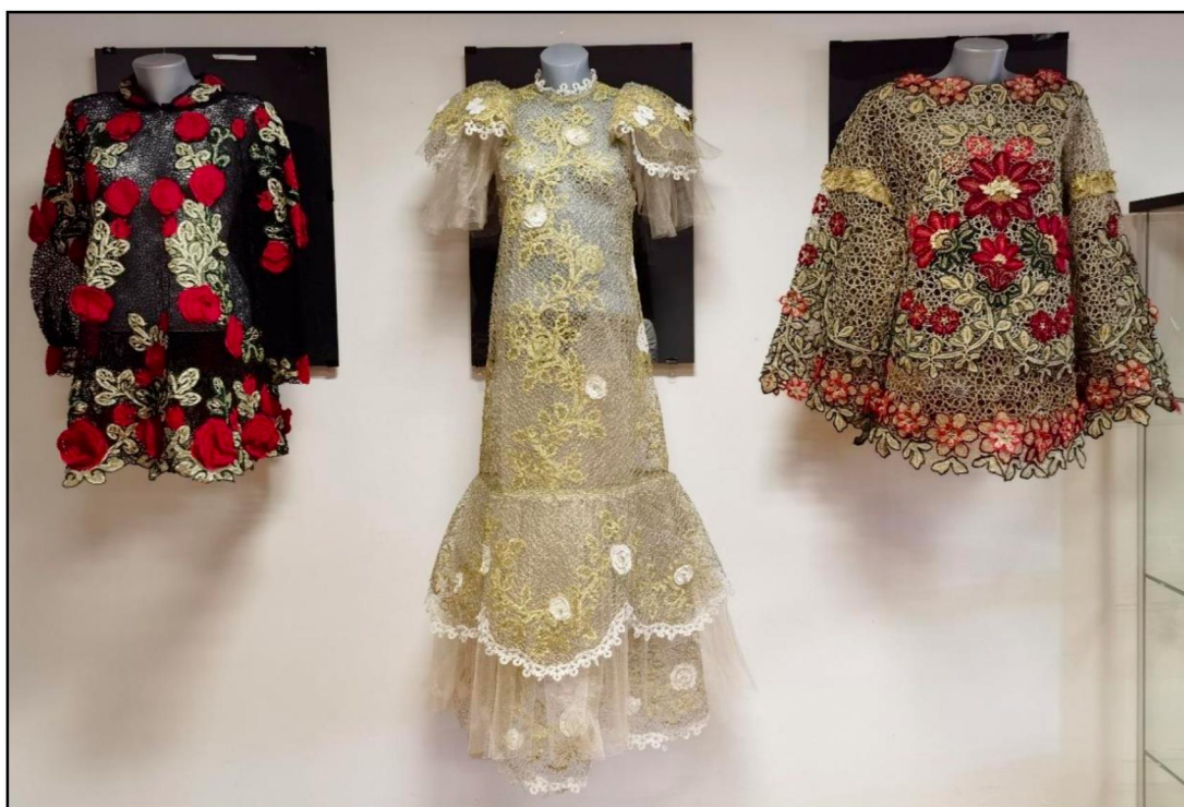
Рис. 2. Выпускные квалификационные работы студентов кафедры художественного кружевоплетения Высшей школы народных искусств (академии) на экспозиции выставки «Великолепие художественного наследия России»