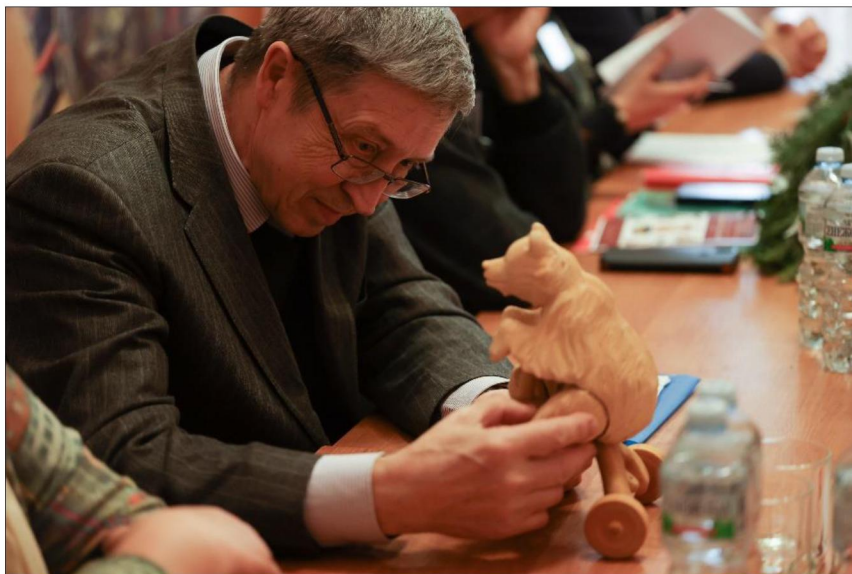
Рис. 3, 4. Работа секций XV Бартрамовских чтений