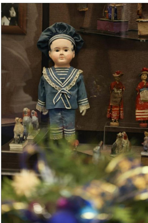
Рис. 5. Фрагмент экспозиции Художественно-педагогического музея игрушки им. Н.Д. Бартрама