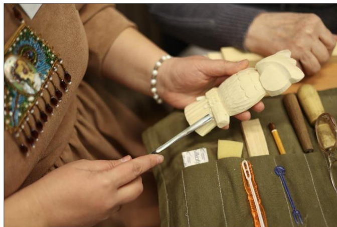
Рис. 6, 7. Участники мастер-классов «Новогодняя игрушка» и игрушка «Сова»

С целью совершенствования опыта проведения научных мероприятий организаторы предложили участникам ответить на вопросы разработанной анкеты; осмысление полученных результатов станет импульсом для дальнейшего развития Бартрамовских чтений.