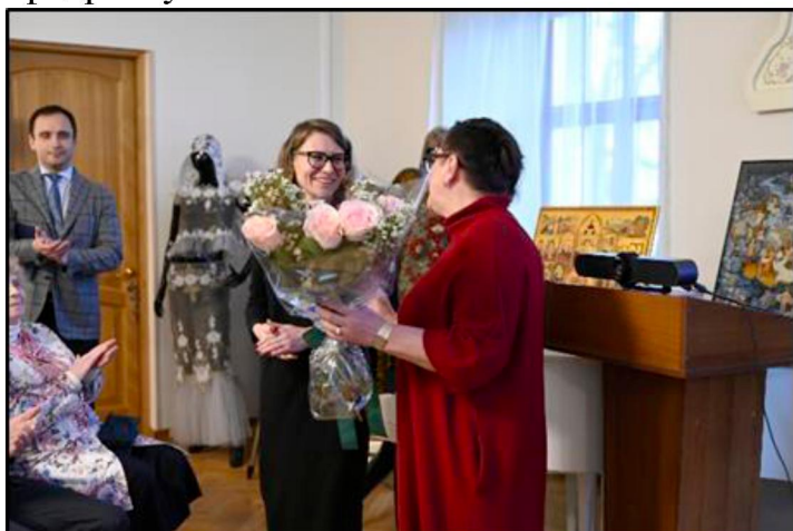
Рис. 10. Открытие выставки

Торжественное открытие выставки состоялось 9 ноября 2023 г. 20-летие отмечали и филиалы, каждый из которых подготовил торжественное мероприятие, выставку, видеоролик, размещенные в социальных сетях (рис. 10). Все филиалы поздравили Академию с юбилейной датой, Московский институт традиционного прикладного искусства сделал особый дар – флаг Высшей школы народных искусств. Академию поздравил Вологодский Государственный музей-заповедник. О выставке был снят фильм, который посмотрели участники торжественного собрания. После открытия выставки все могли «проплыть» по реке времени, полюбоваться редкими экспонатами, сделать памятное фото в фотозоне (рис. 11), отражающей специфику каждой кафедры вуза.