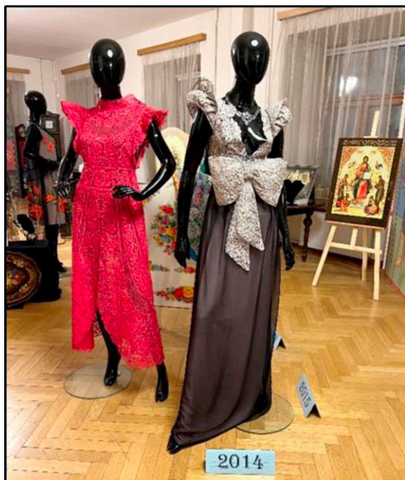
Рис. 5. Фрагмент экспозиции: платье «Бутонов роз и ароматов дивный хмель» и кружевной лиф к платью «Сокровище лунной ночи»

является использование большого количества пар коклюшек, которое может достигать до 1000, кроме того плетение изделия выполняется единым полотном сверху вниз. Многопарная техника кружевоплетения находится на этапе исчезновения, и заслуга Высшей школы народных искусств в том, что академия сохраняет и развивает этот уникальный вид искусства.