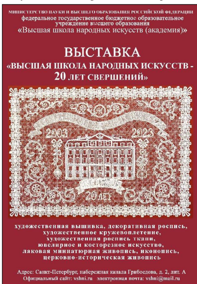
Рис. 1. Плакат выставки «Высшая школа народных искусств – 20 лет свершений»

Высшая школа народных искусств – единственный в мире профильный вуз, осуществляющий подготовку студентов по 22 видам традиционных художественных промыслов, способных создавать уникальные художественные произведения. 2023 г. для Высшей школы народных искусств (академии) ознаменован важным событием – 20-летним юбилеем. С момента основания и по настоящее время проделан огромный объем работы, результат которой выражается в научных, методических, учебных и выпускных квалификационных работах.