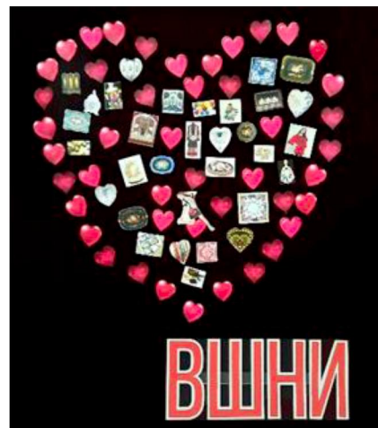
Рис. 11. Фотозона