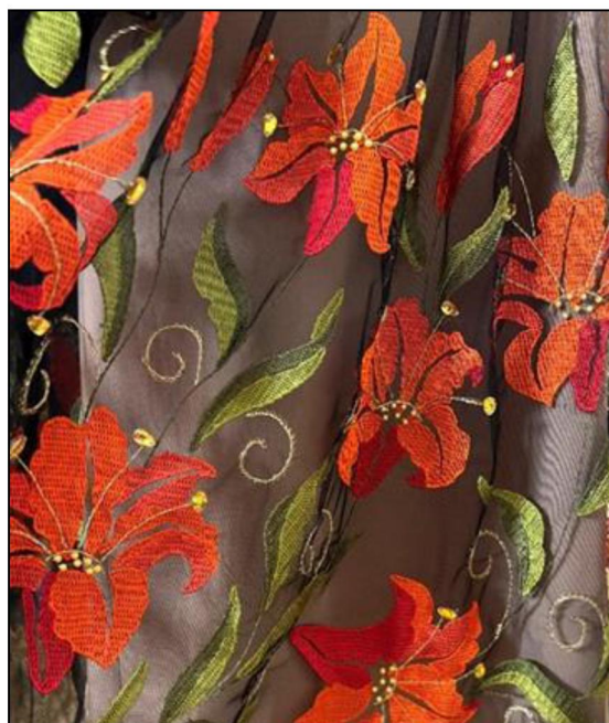
Рис. 8. Фрагмент платья с художественной вышивкой в технике «Русская гладь»

В 2022 г. опубликован каталог «Великолепие художественного наследия России» [2], в котором представлены уникальные высокохудожественные работы студентов головного вуза и его филиалов – шедевры традиционного прикладного искусства, выполненные вручную по собственным художественно-творческим проектам. Представленные работы в каталоге демонстрируют технологические, колористические, композиционные, конструктивные достижения в данной области.