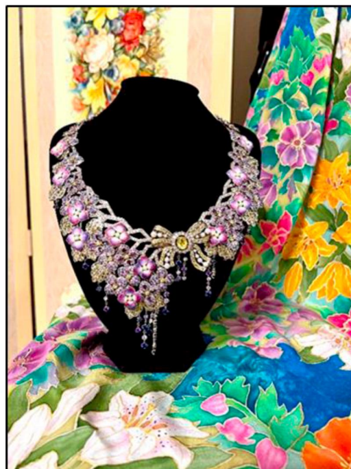
Рис. 6. Фрагмент экспозиции: кольцо «Летняя мелодия», шелковая шаль с художественной росписью

Завершает выставку период 2019–2023 гг. В экспозиции периода представлена мебель и подносы с декоративной росписью с новыми колористическим и орнаментальным решениями. В художественном кружевоплетении прослеживаются инновационные колористические и технологические решения. В изделиях используются новые нити, объёмные элементы, ажурные формы кружева накладываются на тонкий фатин.