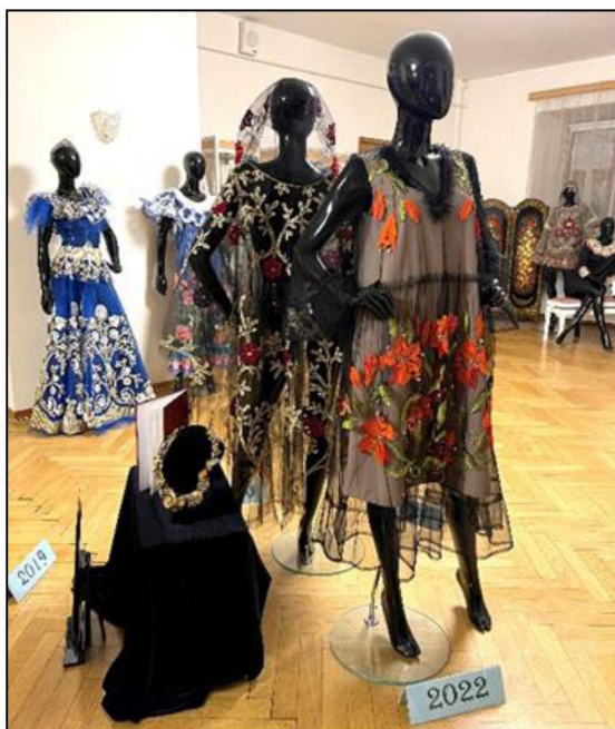
Рис. 7. Фрагмент экспозиции 4 периода 2019-2023 гг.

Инновационные материалы, орнаментальное и колористическое решение представлены в женском платье с художественной вышивкой в технике «Русская гладь» (рис. 7, 8). Платье создано с учетом современных тенденций моды. Впервые вместо традиционной ткани (ранее чаще всего использовался лен) для выполнения художественной вышивки использовали фатин, по которому осуществлена вышивка вискозными нитями. Соединение прозрачной и легкой ткани с плотными и тяжелыми элементами вышивки создают ощущение воздушности и невесомости цветочных мотивов.