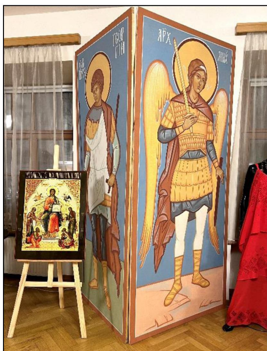
Рис. 4. Фрагмент экспозиции: художественно-творческие проекты росписи храма Святого мученика Уара Троице-Георгиевского монастыря и икона «Спас на троне с