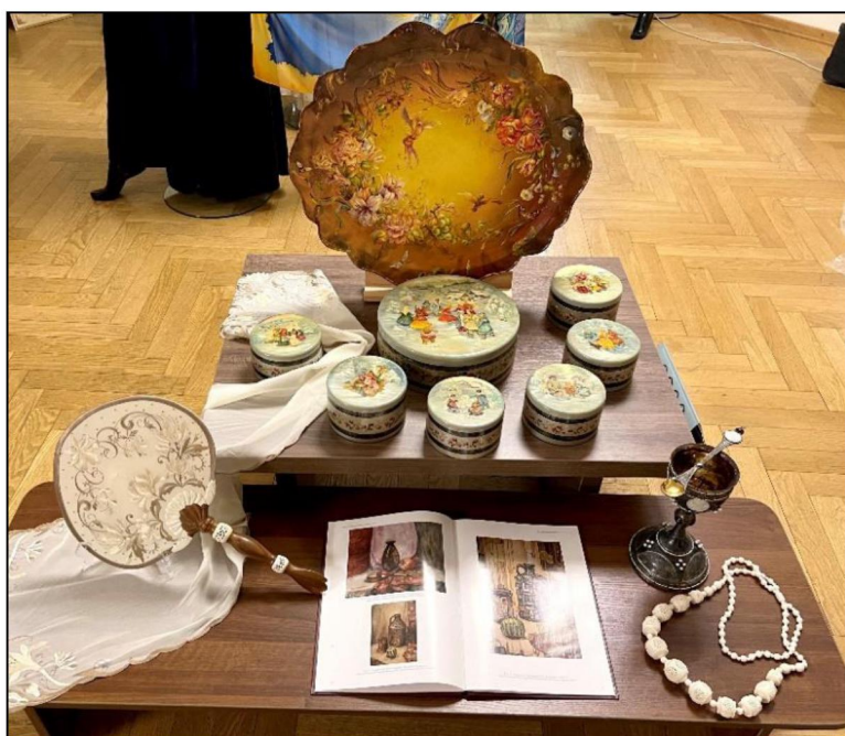
Рис. 2. Произведения первого периода 2003-2009 гг.

Выставочное пространство наполнено работами студентов, которые выполнялись под руководством преподавателей Московской школы