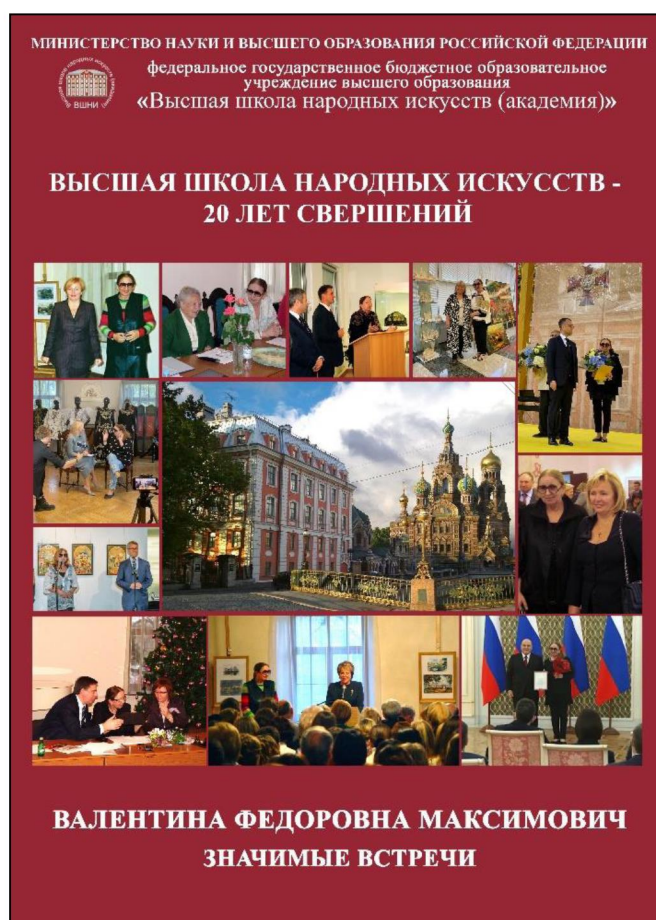
Рис. 9. Плакат выставки «Высшая школа народных искусств – 20 лет свершений. Валентина Федоровна Максимович: значимые встречи»

На выставке представлен плакат «Высшая школа народных искусств – 20 лет свершений» (рис. 9), который дает возможность увидеть эксклюзивные фотографии значимых встреч президента академии В.Ф. Максимович, создавшей Высшую школу народных искусств, которая в то время являлась ректором. На плакате запечатлены встречи с Л.А. Путиной, политическим и государственным деятелем В.И. Матвиенко, депутатом Государственной думы Федерального собрания Российской Федерации Е.А. Вторыгиной, искусствоведом, этнографом, историком и