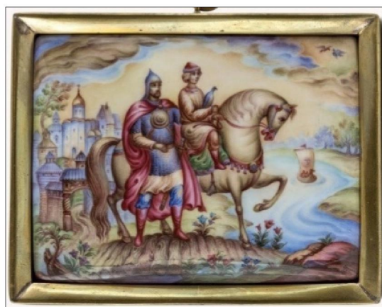
Рис. 4. В.П. Грудинин. «Из Ростова Великого в стольный Киев-град», 1981 г.

Миниатюры В.П. Грудинина отличаются пластичностью линий и светлой, умеренно-яркой колористической гаммой. Неповторимая манера финифтяного письма сочетается с декоративной проработкой мягким «сфумато».