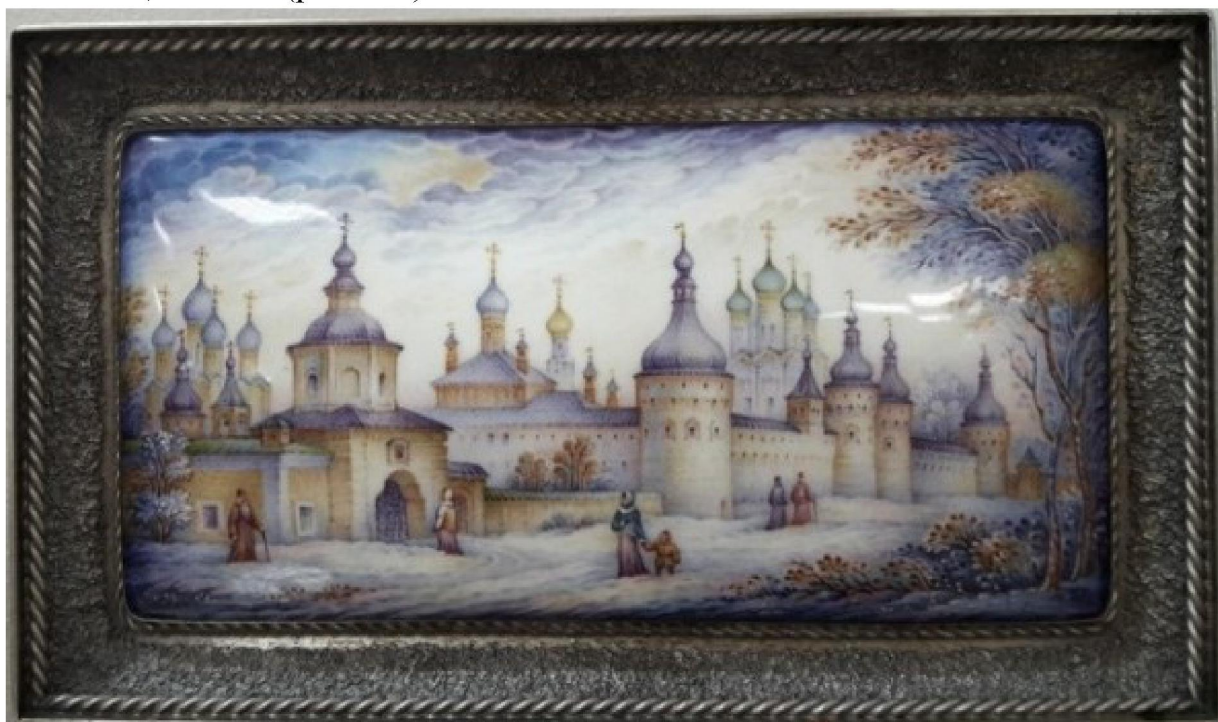
Рис.2. В.П. Грудинин. «Благовест в Ростове Великом», 2000 г. Музей фабрики «Ростовская финифть»

В технике ростовской финифти В.П. Грудинин выполнял миниатюры в различных жанрах: цветочный натюрморт, архитектурный пейзаж, иконописные сюжеты. Наиболее известны исторические миниатюры мастера: триптих «Песнь о вещем Олеге», 1999 г.; панно «Благовест в Ростове Великом», 2000 г. (рис. 2 36 ).