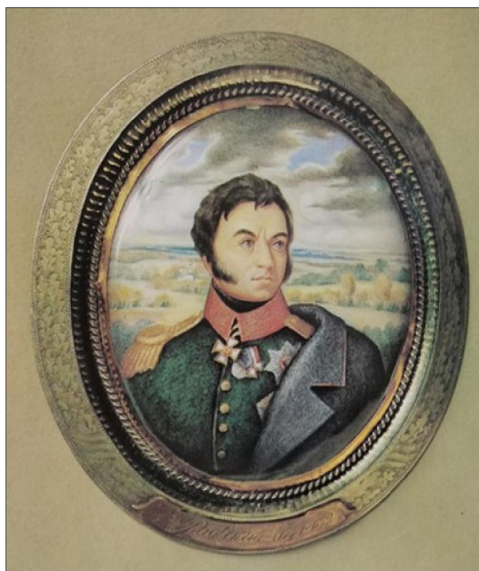
Рис. 13. Б.М. Михайленко. «Портрет героя войны 1812 г. Н.Н. Раевского», 1982 г.

Борис Михайлович – один из известнейших мастеров промысла; фото его произведений опубликованы во всех современных изданиях по ростовской финифти. Б.М. Михайленко признанный мастер портретного жанра в ростовской финифти, а также тематической миниатюры и иконы. Среди известных работ мастера – миниатюры-портреты исторических деятелей: портрет А.А. Титова – видного ростовского историка, исследователя и собирателя финифти; портрет Н.Н. Раевского – героя Отечественной войны 1812 года (рис. 13 45 ); портрет святого праведного Иоанна Кронштадтского. Портреты художников – Андрея Рублёва, В.И. Сурикова, М.А. Врубеля, серия медальонов с портретами русских поэтов и писателей [4, с. 64].