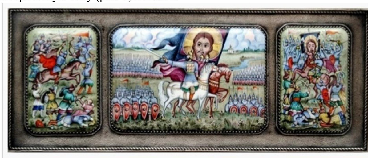
Рис. 6. А.А. Хаунов, Панно-триптих «За землю русскую», 1982 г.

Особенность художественной манеры этого художника заключается в стилистической манере письма, яркости цветовой палитры и тончайшей проработке всех деталей композиции.