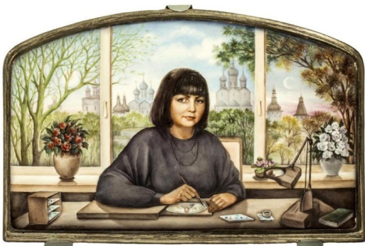
Рис. 16. Л.Д. Самонова. «Автопортрет», 2001 г.

Лариса Долгатовна достигла высокого мастерства в портретном жанре ростовской финифти (рис. 16 48 ). Предпочтение отдает написанию икон [4, с. 79].