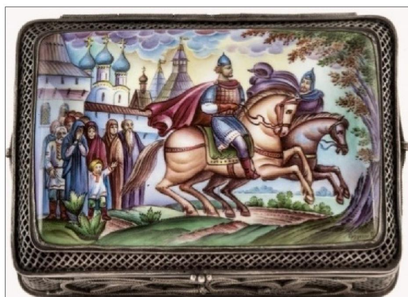
Рис. 3. В.П. Грудинин. «Александр Попович и юный князь Василько», 1987 г

Но особенно ярко творческий потенциал художника проявился в создании композиций сказочно-былинного жанра: «Александр Попович и юный князь Василько», 1987 г. (рис. 3 37 ); «Из Ростова Великого в стольный Киев-град», 1981 г. (рис. 4).