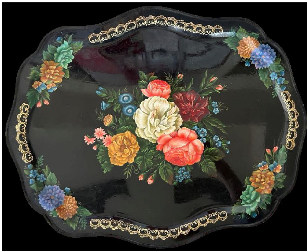
Рис. 1. А.О. Мелихова, студентка III курса. Копия подноса с цветочной композицией в технике «Многослойная роспись» 22

Студенты бакалавриата, выполняя это задание, знакомятся с техникой многослойной росписи и технологической последовательностью ее выполнения. При этом формируются: знания изобразительных и технических приемов и материалов; умения создавать целостную композицию на плоскости и в объеме, передавать четкое изображение рисунка, воспроизводить в точности тонально-цветовые отношения; навыки выполнения точной копии изделий с декоративной росписью. Освоив художественные навыки в росписи каждого художественного элемента, студенты обогащают свою живописную палитру, расширяют диапазон изобразительных мотивов и художественно-выразительных средств, актуализируют воображение. Это способствует постепенному формированию проектной культуры.