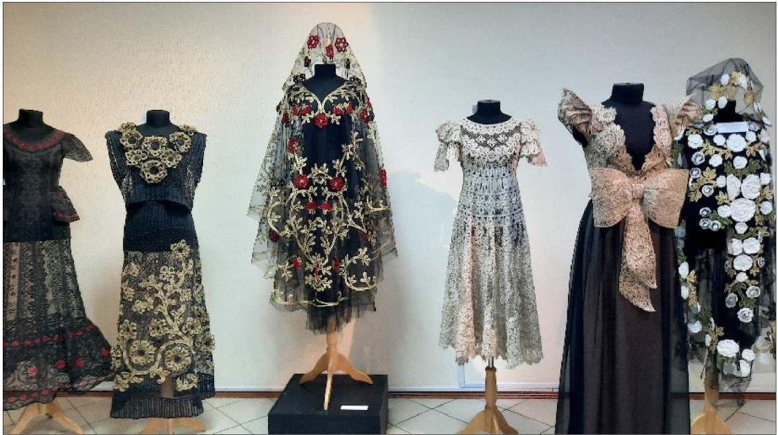
Рис. 5. Экспозиция выставки «Великолепие художественного наследия России (художественное кружевоплетение)