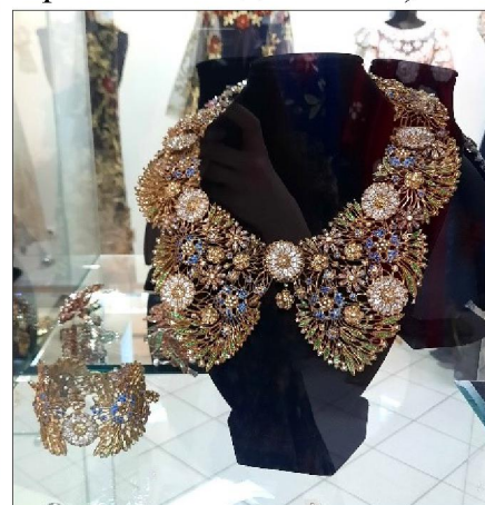
Рис. 4. Экспозиция выставки «Великолепие художественного наследия России» в Нижнетагильском музее изобразительных искусств (богородская художественная резьба по дереву, ювелирное искусство)