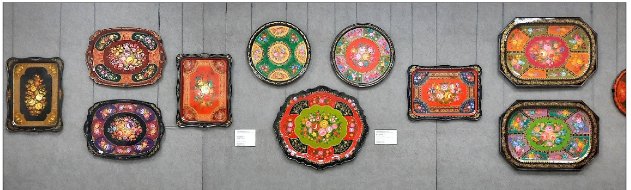
Рис. 6. Экспозиция выставки «Великолепие художественного наследия России» (нижнетагильская художественная роспись)