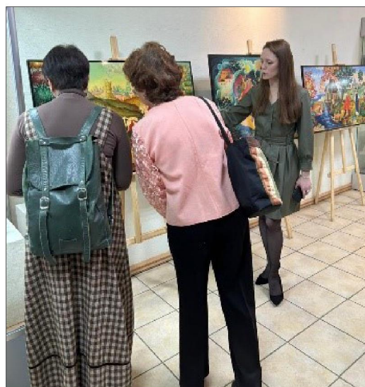
Рис. 2. Обзорная экскурсия по выставке

В экспозиции выставки представлены работы по богородской художественной резьбе по дереву, которые вошли в перечень образцов изделий народных художественных промыслов признанного художественного достоинства (Приказ Минпромторга России от 13 марта 2023 года № 789).