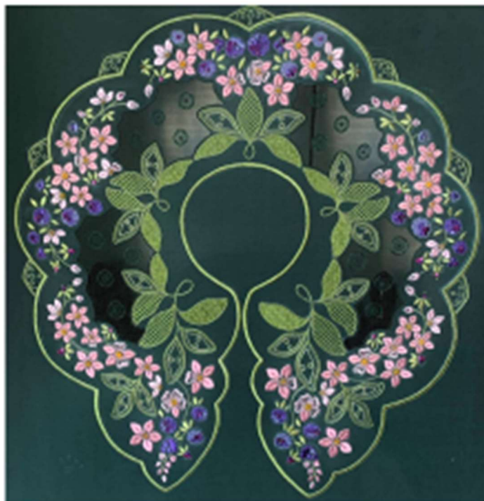
Рис. 1. Женский воротник, декорированный олонекским шитьем с использованием современных материалов