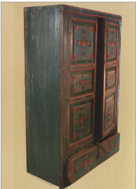
Рис. 2. Шкаф посудный, подвесной. 1902 г. 125x83x35. Место изготовления и бытования д. Тармакла Муромцевского района. ООМНИИ, отдел декоративно-прикладного искусства, фонд народного искусства.

В настоящее время с ранними подлинными образцами произведений урало-сибирской росписи можно познакомиться в музейных собраниях – музее изобразительного искусства им. М.А. Врубеля и Омском историко-краеведческом музее. Уникальность экспозиций этих музеев заключается в том, что они представляют произведения с мотивами росписи, которые предположительно являлись частью быта переселенцев. В их оформлении сохраняется родство с культурой Центрально-Европейской части России, но также есть отличительные особенности. Эти вещи датируются XVII–XVIII веками (рис. 1).