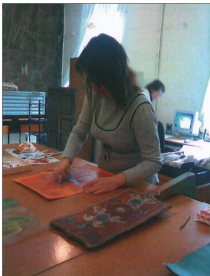
Рис. 3. Копирование техники урало-сибирской росписи с музейного экспоната

В настоящее время существенное значение в формировании навыков художественной росписи имеет не только обучение в рамках учебных занятий, но и собственная кропотливая работа, стремление к самообразованию. Возникает необходимость участия в экспедициях, исследованиях музейных экспонатов, изделий из запасников, не ограничиваясь несколькими вещами,