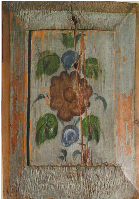
Рис. 1. Филенка. Фрагмент росписи интерьера горницы. Конец XIX – начало XX вв.