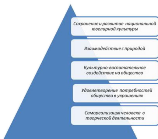
Рис. 1. Структурно-функциональная модель взаимодействий в системе «ювелирная культура – профессиональное образование»

Структурно-функциональная модель взаимодействий в профессиональном образовании в ювелирном искусстве – сложное образование, в которое входят учебные заведения, в которых ведется подготовка кадров для ювелирного искусства, преподаватели, студенты, производители, распространители и потребители, являющиеся одновременно и субъектами, и объектами процесса формирования ювелирной культуры, а также субъектами взаимодействий в изучаемой системе (рис. 1). Согласно С.А. Ильиных «процесс социодинамики профессионального образования в области ювелирного искусства совершается в соответствии с определенными закономерностями, к числу которых относятся закономерность нарушения прежнего равновесия, закономерность адаптации, закономерность несогласованности когнитивных и поведенческих реакций, закономерность инновации» [6].