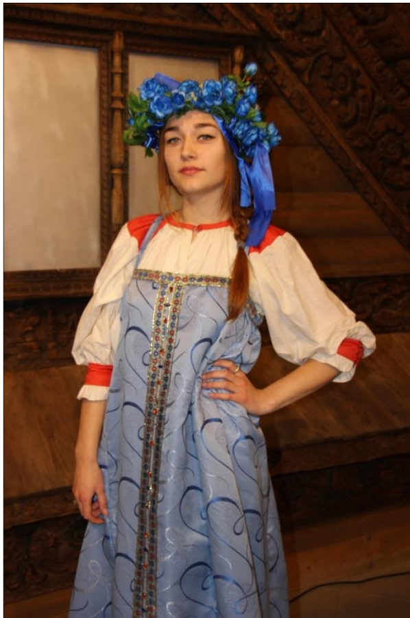
Рис. 8. Сарафанный тип женского костюма. Рубаха с косыми поликами. Автор Захарова Ю.2013 г.