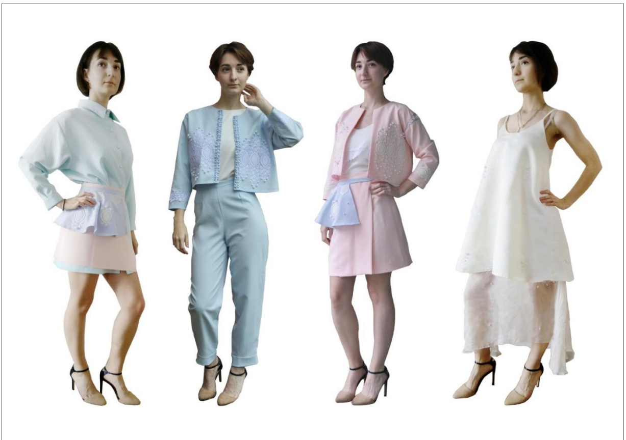
Рис. 19. Коллекция «Русский стиль». Автор Андреева К. 2018 г.