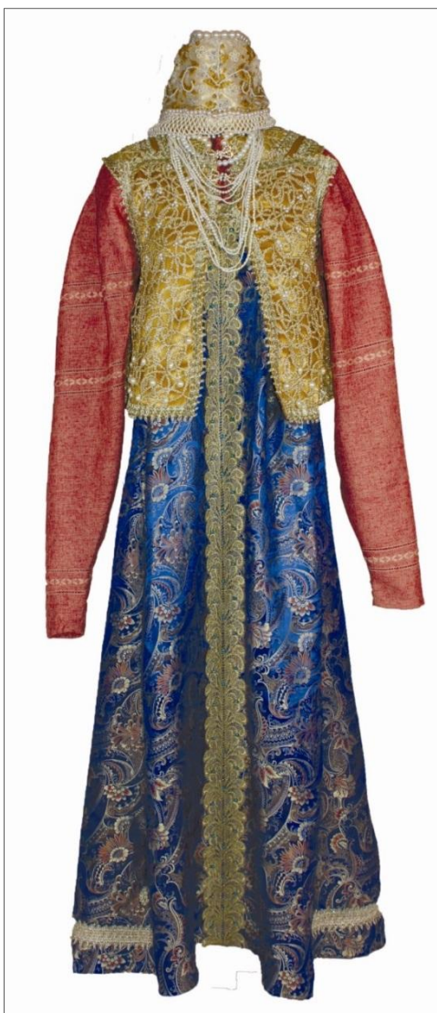
Рис. 6. Костюм русского Севера Авторы: сарафан – Красавина Е., головной убор – Пикина В., душегрея – Стальнова М. 2017 г.

тенденции европейской моды, но используя при этом российские мотивы и традиции. В 1925 году в Париже, на Всемирной выставке, ее коллекция получает «Гран При». Модели коллекции Н.П. Ламановой и многочисленные публикации в различных журналах доказали, что народный костюм является превосходным источником творчества и может служить неиссякаемым материалом. Стиль «а-ля-рюс» вошел в европейскую моду только благодаря работам Н.П. Ламановой. Простые ситцевые ткани, шинельное сукно, владимирские полотенца – все использовалось для изготовления изделий. Она предлагала классический русский прямоугольный крой в современных костюмах, что актуально и для наших дней (рис. 10).