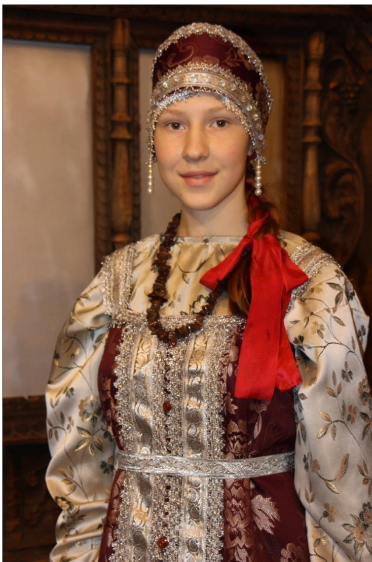
Рис. 7. Сарафанный тип женского костюма. Рубаха с прямыми поликами. Автор Лигонькова К. 2007 г.