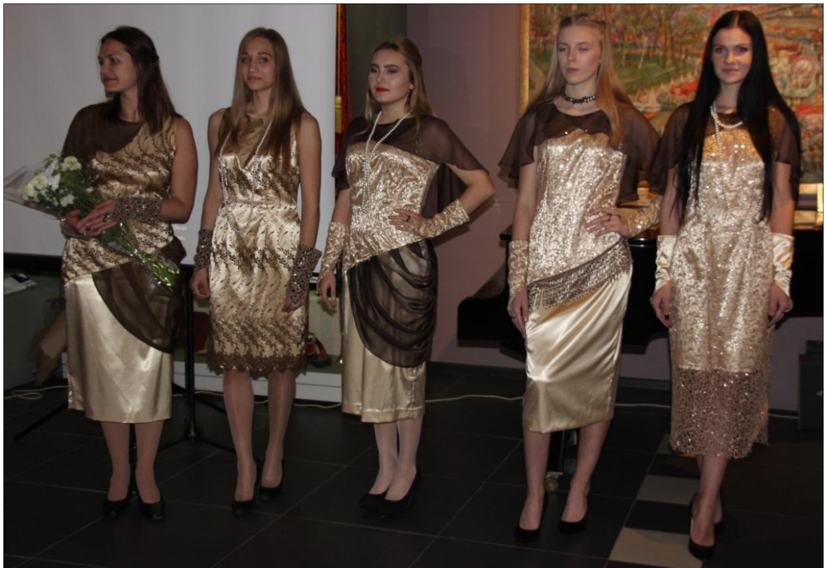
Рис. 18. Коллекция «Красная дорожка». Автор Колдашова Т. Международный конкурс «Неделя моды в Москве» 2017 г.