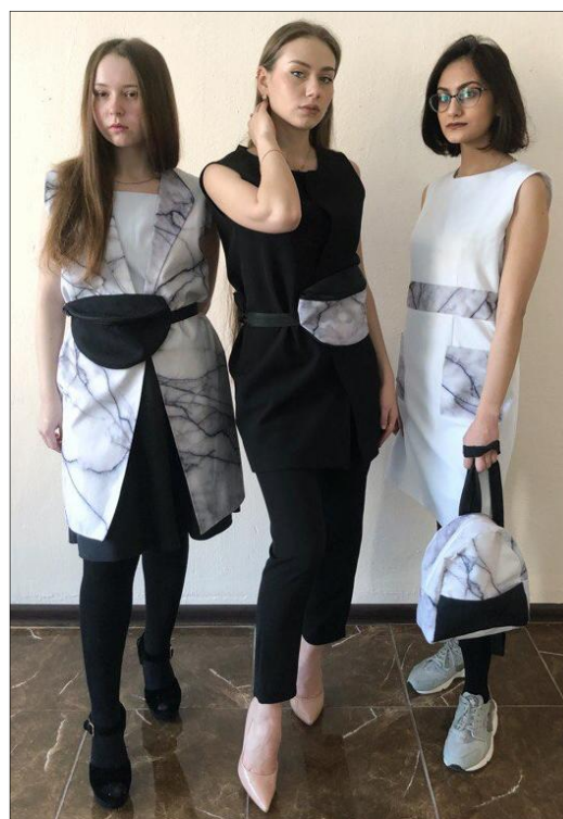
Рис. 15. Коллекция «Переливы мрамора». Автор Малетина И. 2018 г.