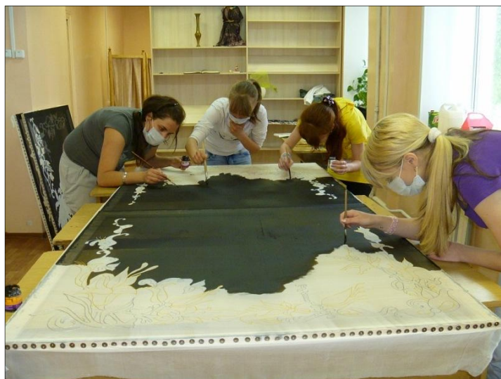
Рис. 13. Студенты за работой

Полностью отсутствуют отходы или их показатели сводятся к минимуму (рис. 16-19).