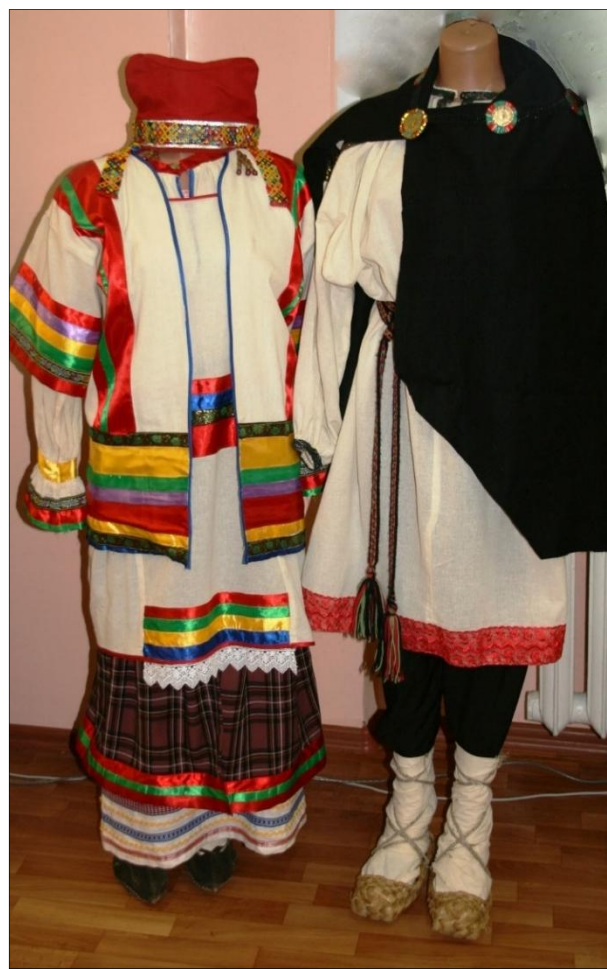
Рис. 2. Мужской народный костюм.

Основу русского костюма во все времена составляла рубаха (в некоторых источниках её называют сорочкой). По покрою у мужчин и женщин она отличалась только длиной. Горловина, низ рукавов и низ стана украшался символической широкой и богатой вышивкой. Сплошной вышитый орнамент на этих местах выполнял защитную функцию, охранял от злых духов, которые