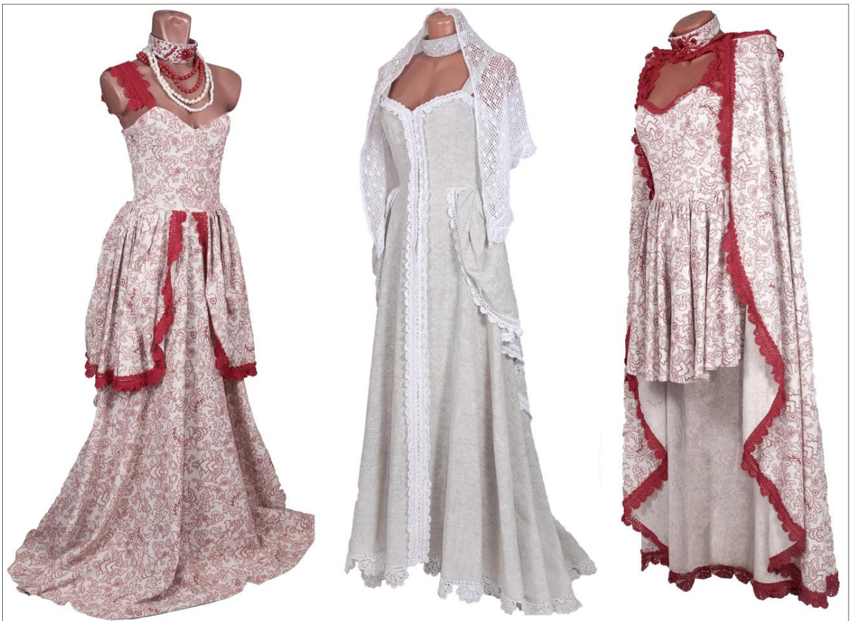
Рис. 17. Коллекция «Русское поле». Автор Плужник В. 2015 г.