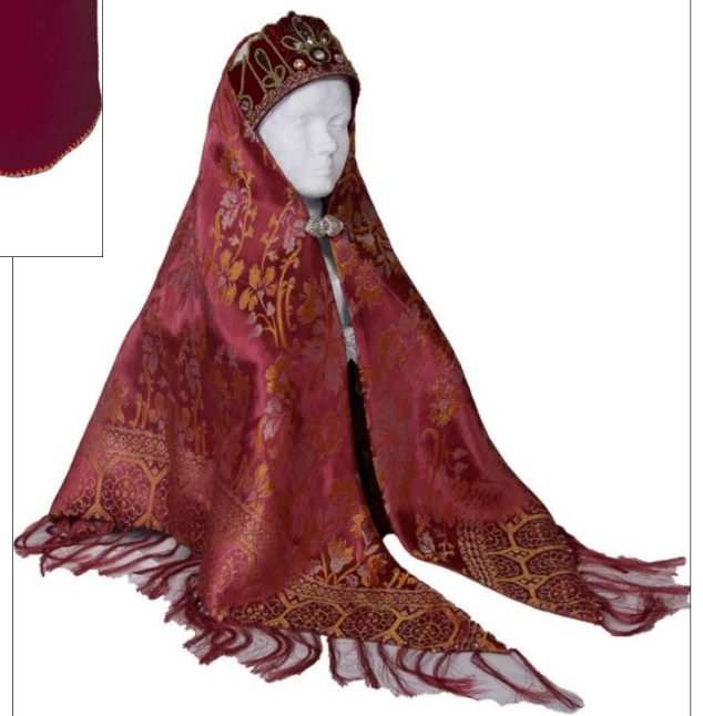
Рис. 5. Головной убор повойник с высоким околышком и платок-убрус.

Одним из распространенных видов русской одежды XV века становится сарафан. Сарафан очень органично вписался в традиционный русский костюм данного периода, он придавал женщине статность и стройность. Появившейся сарафан показал удобство ношения прежней удлиненной понёвы с небольшими бретелями на плечах. Для