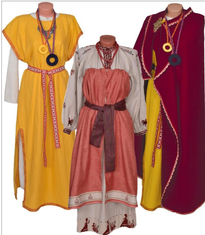
Рис. 4. Костюм женский. завышенная панёва по линии груди.

Авторы: Лукина Е., Телегина М. 2017 г. русского костюма характерно несколько видов сарафанов, которые различались по покрою. Все они составляют северорусский сарафанный тип костюма (рис. 6–9).