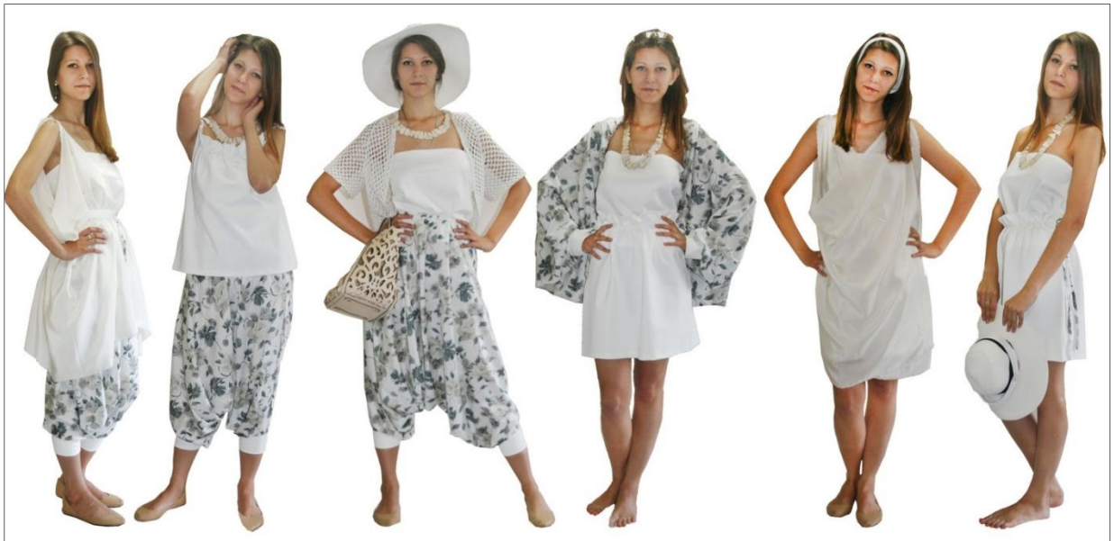
Рис. 16. Коллекция «Нежность». Автор Лысенко А. 2015 г.