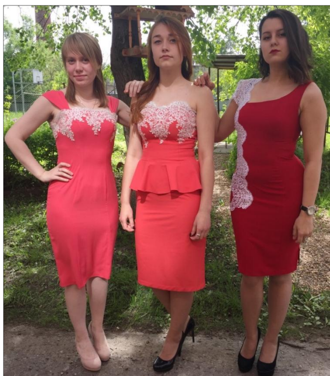
Рис. 14. Коллекция «Роза в снегу». Автор Кутилина В. 2018 г.