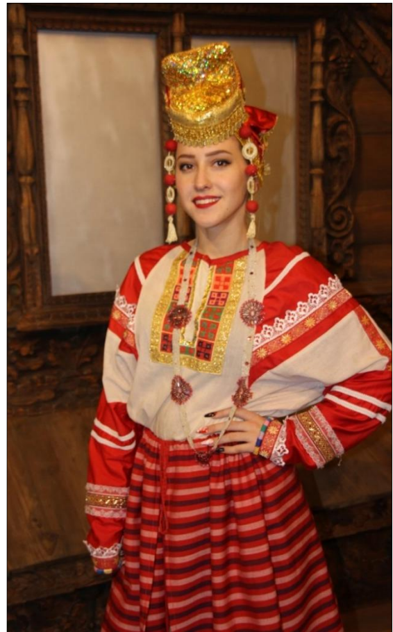
Рис. 9. Поневный тип женского костюма. Рубаха с косыми поликами. Автор Касакевич М. 2007 г.