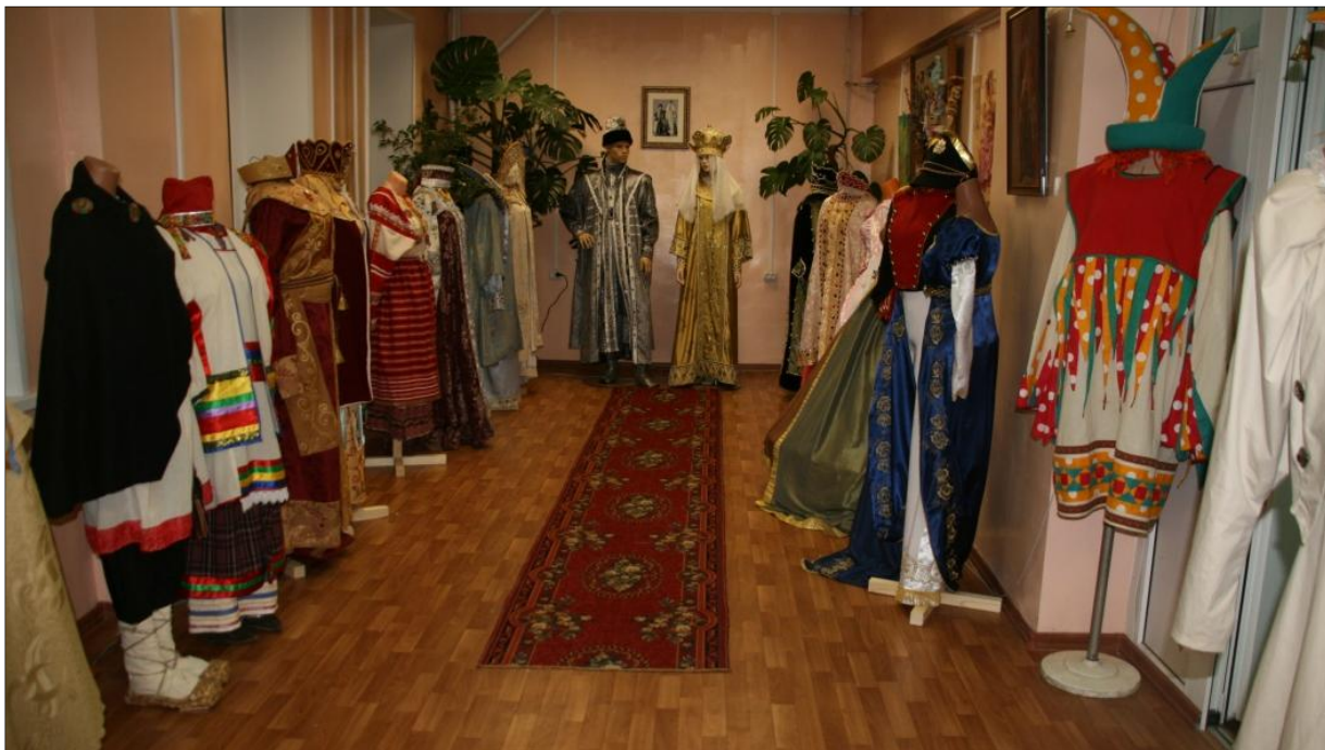
Рис.1. Студенческий «Театр истории костюма»

При реновации исторического костюма, а затем во время демонстрации своей работы на различных мероприятиях, конкурсах, презентациях, выставках: создается уникальная образовательная среда для формирования у студентов особого отношения к культурно-историческому наследию. «Театр истории костюма» позволяет студентам лучше ориентироваться в исторической действительности. В силу своих специфических возможностей он способен дать знания о культурном историческом прошлом, преобразовав их в ощущения своей сопричастности к былому. Работа по исследованию исторического костюма и выполнению его образца в материале является одним из направлений научно – исследовательской работы кафедры «Профессиональных дисциплин». «Театр истории костюма» Сергиево-Посадского института игрушки – филиала ВШНИ(А), играет важную роль в духовном развитии личности студента, является местом изготовления, собора, хранения, демонстрации аксессуаров, головных уборов, обуви, украшений, исторических костюмов, научно-исследовательских коллекций. Он является ведущей формой работы по патриотическому, гражданскому, общекультурному, духовному развитию студентов, интегрирующей целью формирования личности гражданина России в процессе учебной и вне учебной деятельности института (рис. 1).