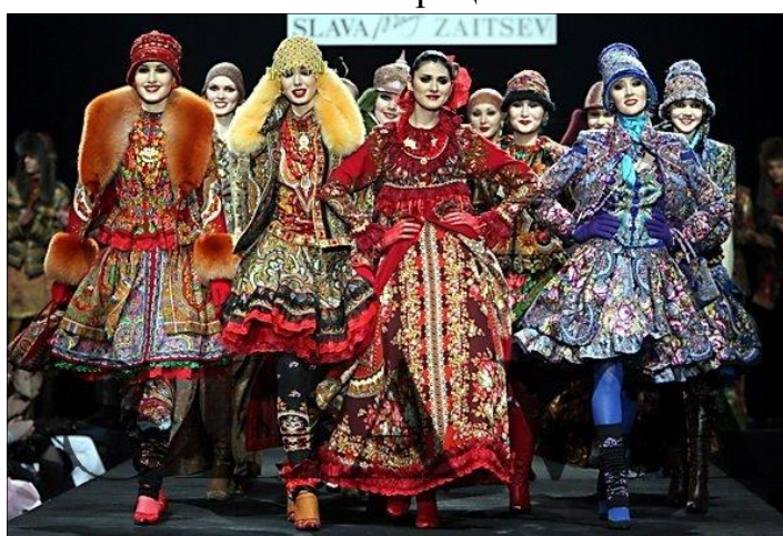
Рис. 1. Коллекция Вячеслава Зайцева