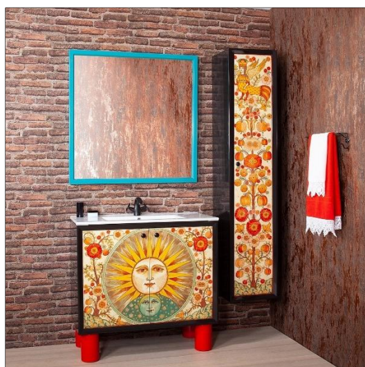
Рис.8. Арт-объект от Н. Шевченко