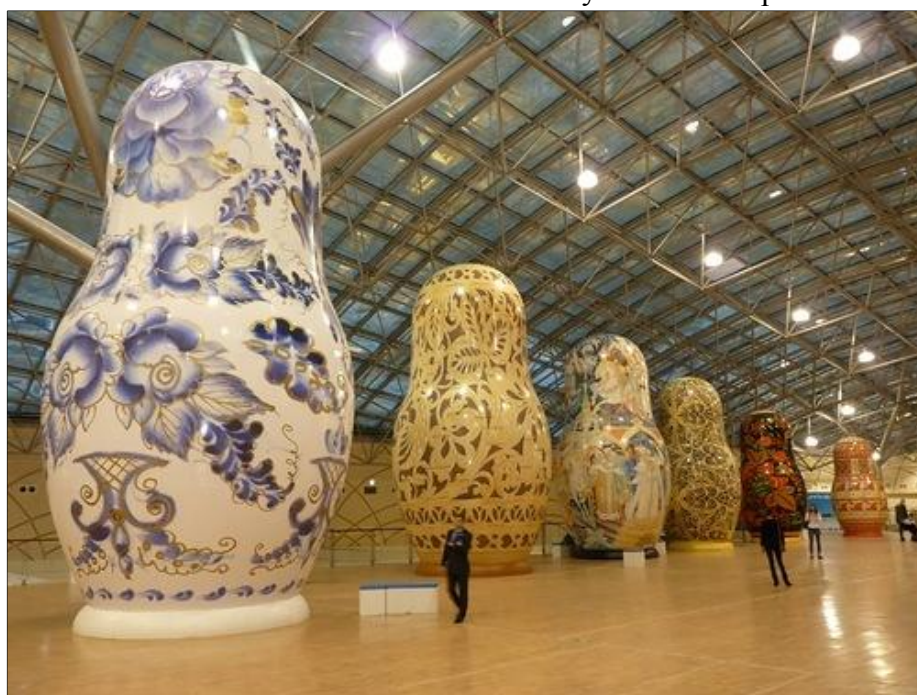
Рис. 11. Гигантские матрешки художника-сценографа Б. Краснова