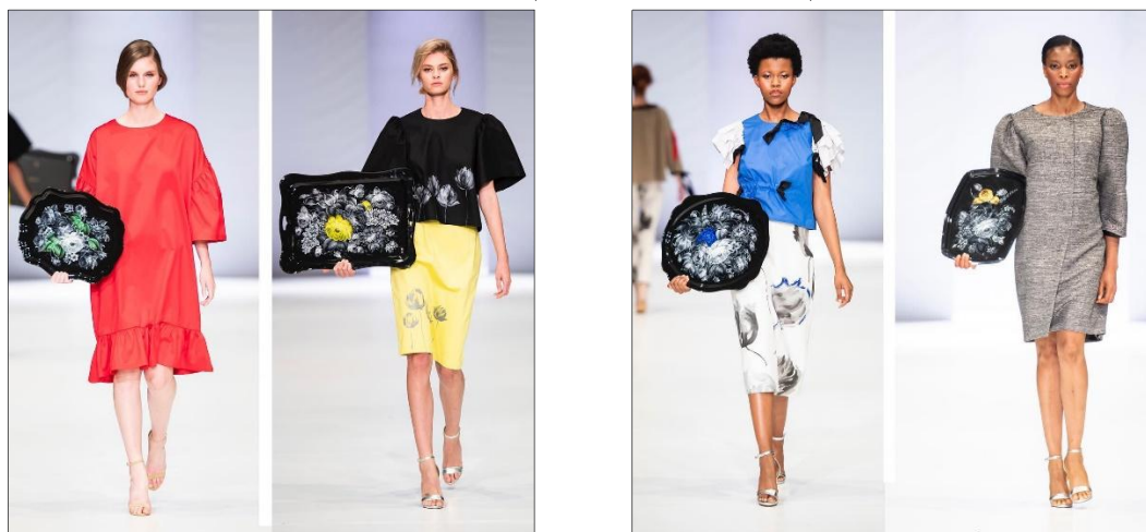
Рис. 2-3. Коллекция бренда SERGEY SYSOEV