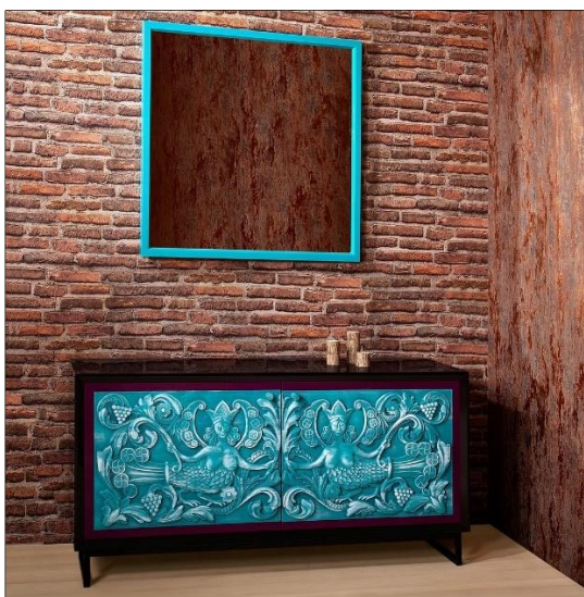
Рис. 9. Арт-объект от Н. Шевченко