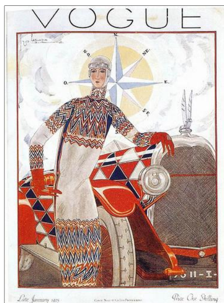
Рис. 6. Обложка журнала «VOGUE».