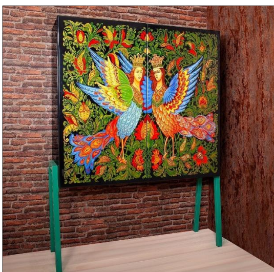
Рис. 7. Арт-объект от Н. Шевченко