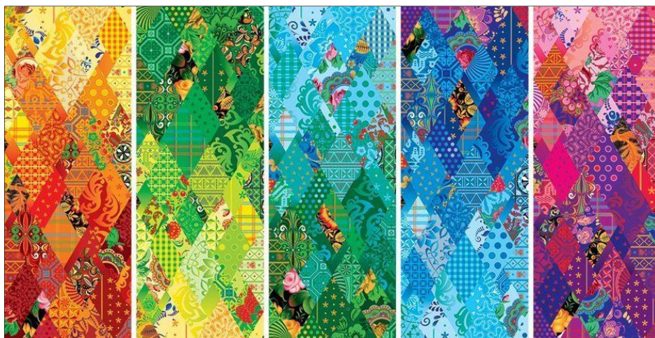
Рис. 12. Визуальный образ XXII Олимпийских зимних игр в Сочи