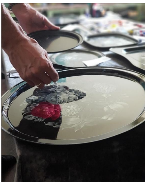
Рис 5. Поднос в технике «кьяроскуро».