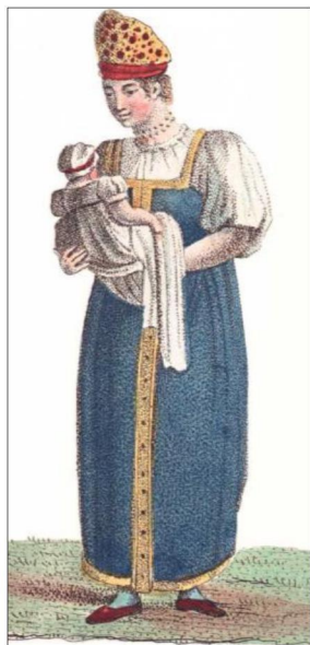
Рис.1. Кормилица. Ж.-Б. Бретон.1813

и белые дощечки, что необходимо для удобнейшего надзора за питомцами как со стороны врача, так и других лиц» [3, с. 175-176]. Труд кормилицы оплачивался в зависимости от возраста ребенка.