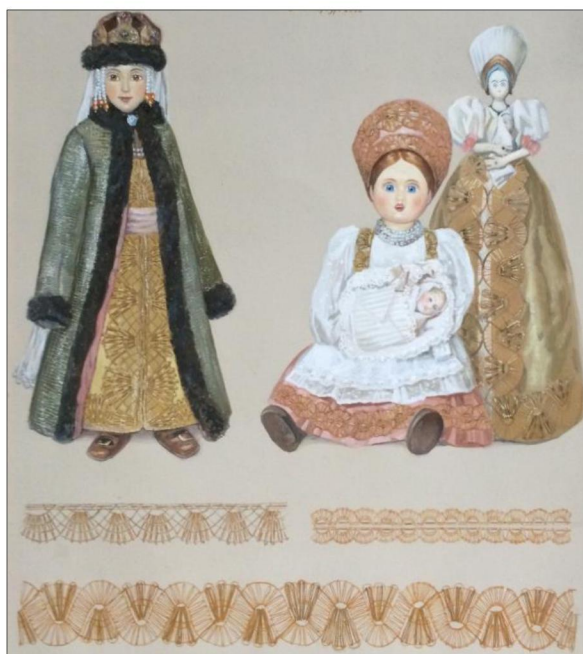
Рис.3 Куклы и реновация декора кукольного костюма – металлического кружева