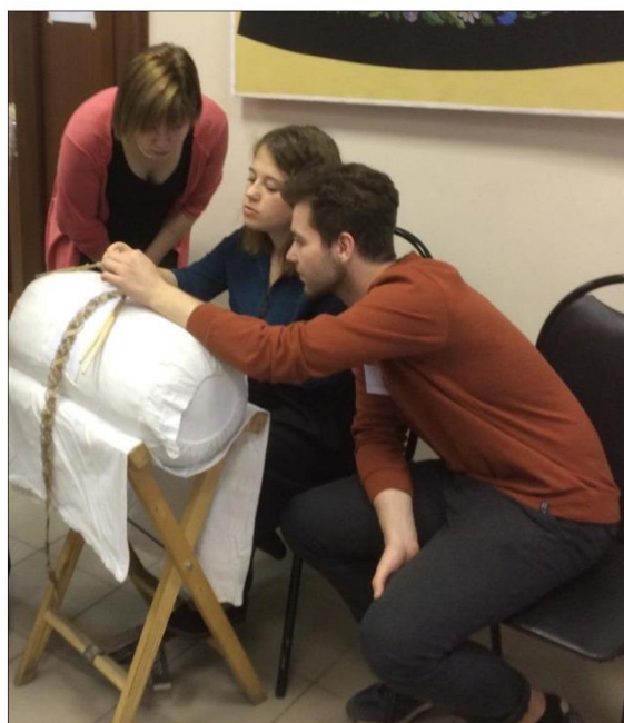
Рис.4. Мастер-класс «Воссоздание технологии плетения старинного металлического кружева»