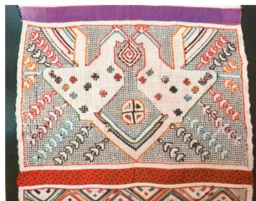
Полотенце. Вторая половина XIX века Бежецкий уезд, Тверская губерния. Вышивка шерстяными нитями по «перевити» 39 x 230 ГРМ, В - 3875