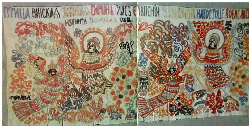
Конец полотенца – образец вышивки Школы народного искусства