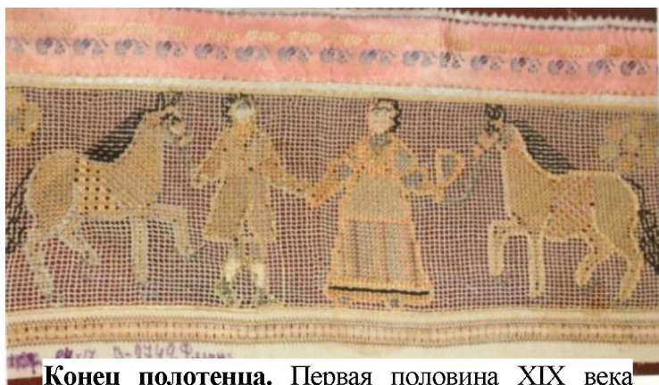
Конец полотенца. Первая половина XIX века Рязанская губерния. Вышивка льняными и шелковыми нитями по перевити. 18 X 84 ГРМ, В – 3875